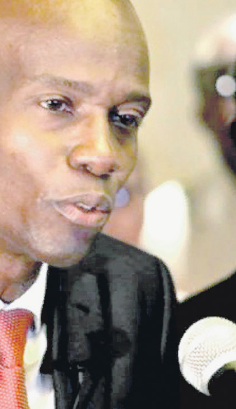
Убит Жовенель Моиз, тяжело ранена Мартин Моиз

Жозеф осудил убийство президента, назвав его актом варварства. Премьер призвал к спокойствию и сказал, что полиция и армия будут поддерживать порядок в стране, а ситуация с безопасностью находится под контролем.