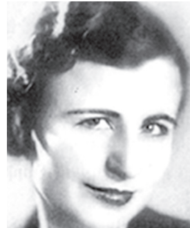
ՄԱՆՈՒՇՅԱՆ ՄԵԼԻՆԵ Ֆրանսիայի ազգային հերոս