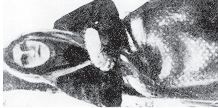
Աղավթի Վարդապետյան (Վանի քաղաքապետի հերոսուհին)