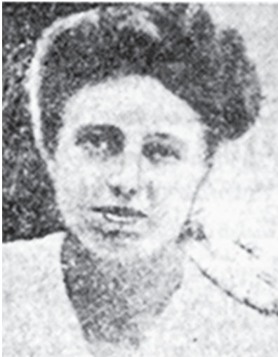
ՄԻԱ ՔՕԼԴ Գըրտթոտի Ամերիկեան վարժարանի տնօրէնուհին