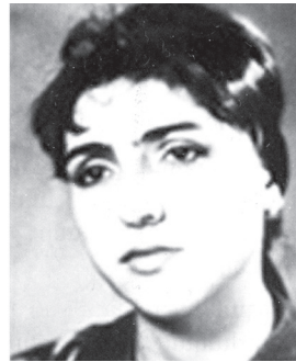
ԱՌՐՅԱՆ ՍՏԱԼԻՆԱ ԽՈՐԵՆԻ Ազատամարտիկ