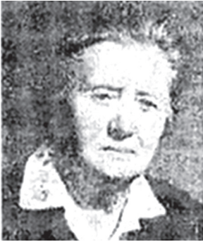
ԶՈԼՆԻՏՆԱ ՔՎԱՄԱՐՎ ՎԱՂԱՐՇԱԿԻ Մեծ հայրենականի մասնակից