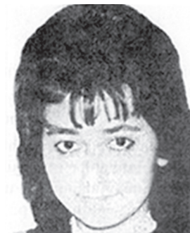
ԲԴՈՅԱՆ ՀԵՂԻՆԵ ԼՅՈՒՂՎԻԳԻ Ազատամարտիկ