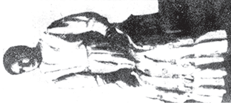
Սևն (Այգեստանի 20 տարեկան հերոսուհի տղիանդակ)