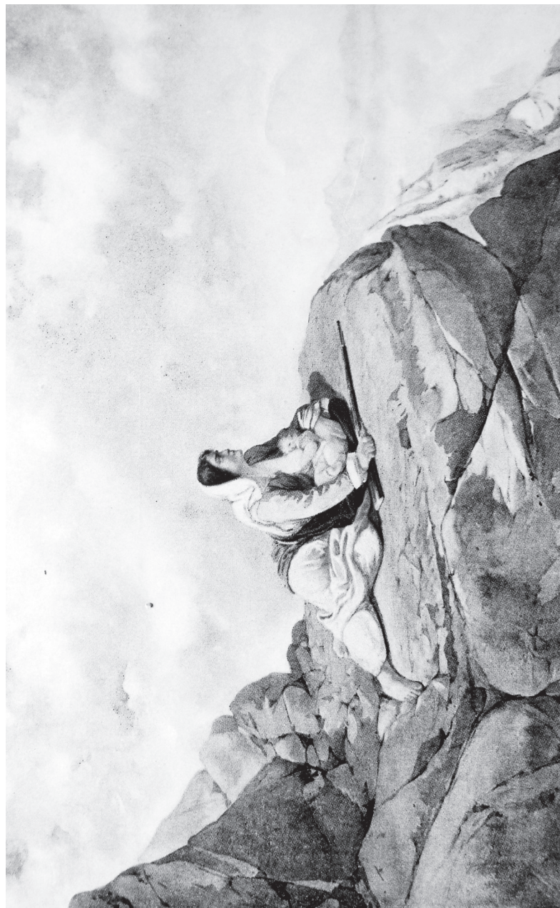
Մանուկ Հայաստան Նկար՝ Ա. Ֆիլավանեանի