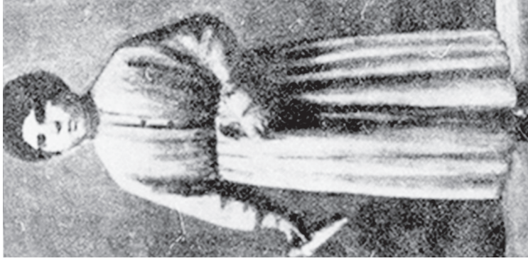
Սիրո (Շատակի տղիանդակ, 12 տարեկան հերոս աղջիկ)