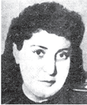
ԴՍԿՈՅԱ ՇՈՂԱԿԱԹ ԴԵՏՐՈՍԻ Մեծ հայրենականի մասնակից