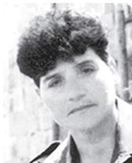
ՍԱՀԱԿՅԱՆ ԱՐԱՎՆԻ ԱՐԱՍՈՒ Ազատամարտիկ-բուժքույր