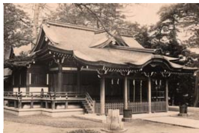
再建竣工時の拝殿（檜皮葺き）