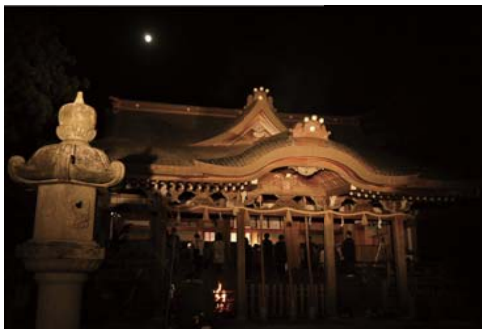
ライトアップされる拝殿