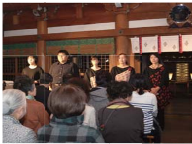
マリンバアンサンブル紫音