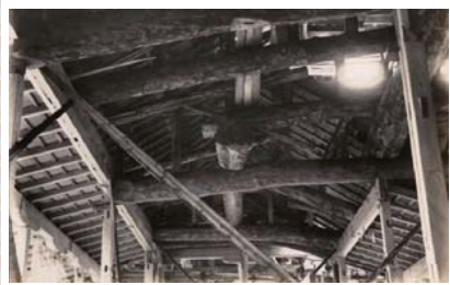
復興再建中の拝殿内