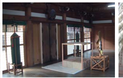
仮殿が設けられた拝殿