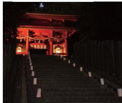
石段に並べられる雪洞