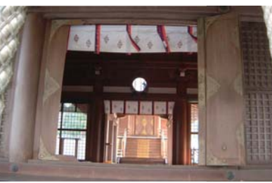
台風被害で吹き飛んだ御扉