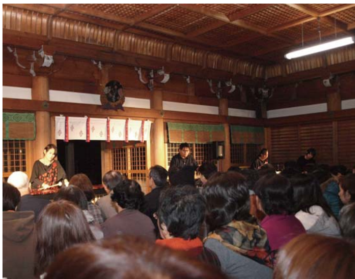
拝殿ではじめてのマリンバコンサート

石段には雪洞が並べられ、足下をほのかに照らし、本殿の背後には晴天の夜空に見事な月が浮かび幽玄の世界が繰り広げられました。