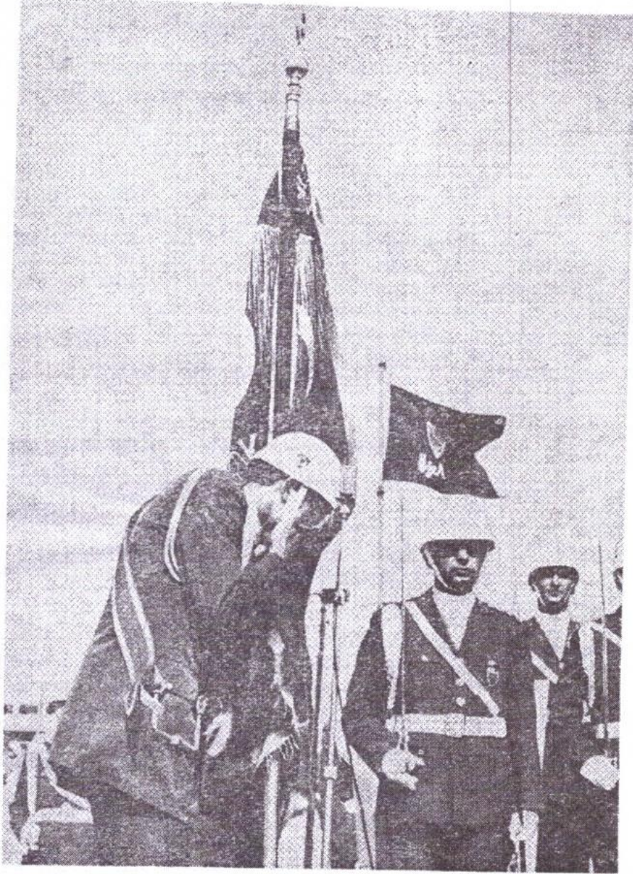
YURDA BAŞ DEDİKLERİ BİR AĞIR ADAKLA GELDİLER VE ŞU BAYRAKSIZ DÜNYAYA BAYRAKLA GELDİLER