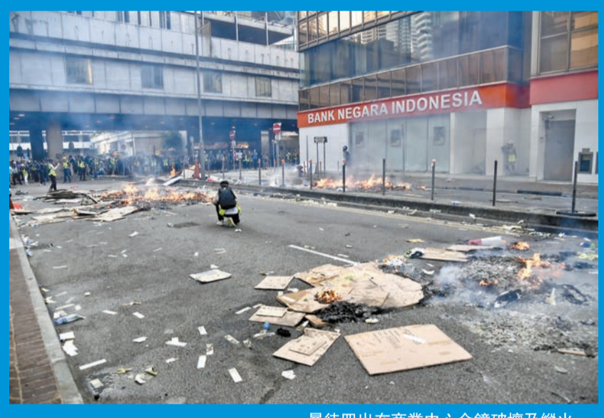
暴徒四出在商業中心金鐘破壞及縱火。