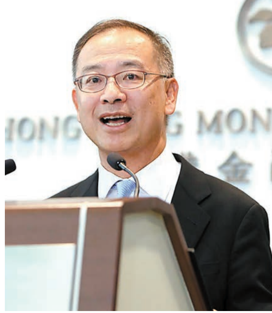
余偉文首日履新，強調致力與團隊維持香港金融穩定。

業界等開會，提醒銀行應以包容態度盡量支持中小企，例如不要貿然收回面臨財困中小企的貸款。此外，當局將增設協調機制，運用收集得來的意見以改良現有機制。