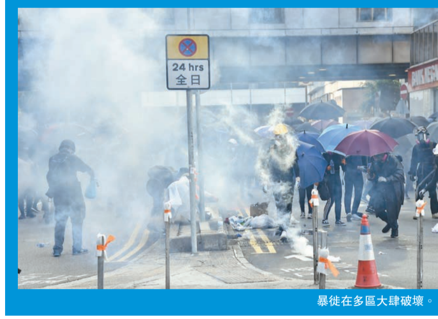
暴徒在多區大肆破壞。

政府發言人指，踏入8月份香港零售業進一步明顯轉差，跌幅較1998年9月份即亞洲金融風暴時更差；而8月份零售業銷售急跌，除了由於經濟狀況不佳，導致消費情緒疲弱，更反映了本地社會事件，已對