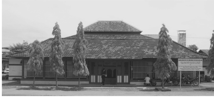
gambar 1. Gedung Volkstheater Sobokartti di Jl. dr. Cipto no. 31-33 Semarang.