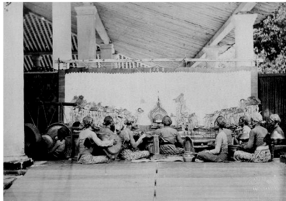
(a) Pementasan wayang kulit di tepi ruang paséban (?), Blora, sekitar 1862