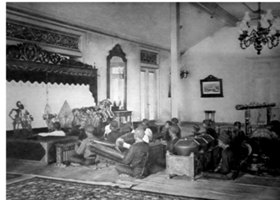
(b) Pementasan wayang kulit di ruang pringgitan ndalem , Yogyakarta