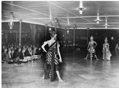
(c) Pementasan wayang wong di pendhapa Kraton Kasultanan Yogyakarta, 6 Agustus 1937