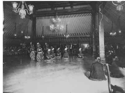
(d) Pementasan tari Bedhaya di Bangsai Kencana Kraton Kasultanan Yogyakarta, antara tahun 1900-1940