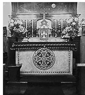
Часовня юрисдикции. Конец 1930-х

Группа всё более приобретала черты оккультного общества и погружалась в эзотерику. От немногочисленных последователей и членов ордена требовалось постоянное духовное и психологическое развитие, в общине практиковались медитативные практики, различные восточные учения, вера в реинкарнацию и т.д. Каждый член общества «должен постоянно экспериментировать и продемонстрировать знания о концентрации, медитации, духовном созерцании, молитве, диетологии, обрядах, духовных упражнениях» 16 и т.д. В общине нет обязательного воздержания от животной пищи, однако алкоголь запрещён. Новые члены, принимаемые в общество, имеют звания «послушников». После годового испытательного срока они становятся обладателями званий «брата» или «сестры». Заявленной целью общества розенкрейцеров является духовное, нравственное и интеллектуальное развитие членов группы и всех людей через учение, которое соединяет