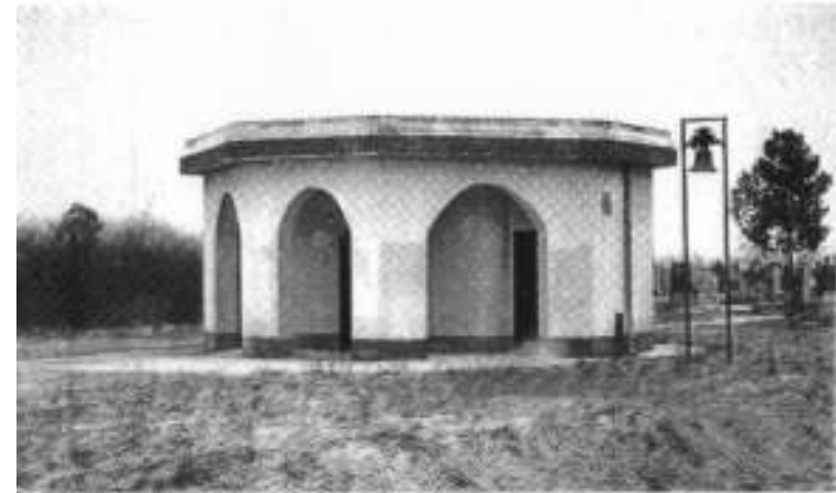
Капела на карловачком гробљу