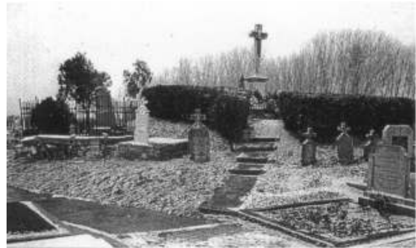
Централни део католичког гробља у Беодри

КИД ПЧЕСА - Прилог из џемаџске књиге (2000) Сеоске ЦРКВЕ и ГРОБЉА у Војводини Драган Рауџки