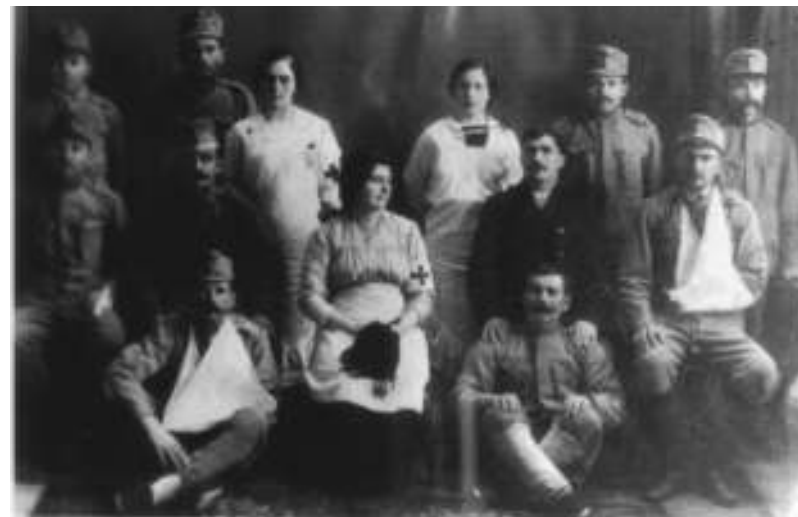
Рањеници из I свејског рајџа у болници у Новом Бечеју (29.3.1915.)