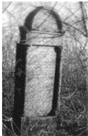
Лево: Једини усправни сјоменик на јеврејском гробљу Десно: Сјоменик на јеврејском гробљу у лежећем положају