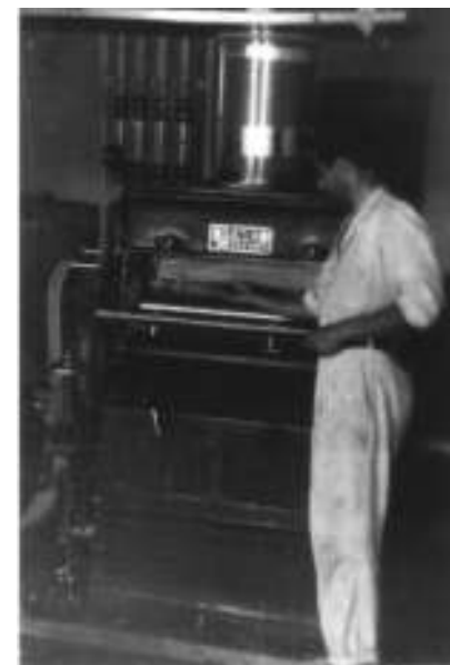
Бранислав Бешлин млинар