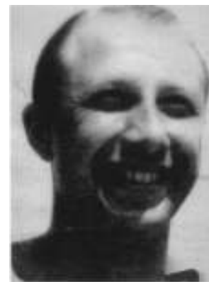
Душко Попов - овако је изгледао кад је срео Јана Флеминга