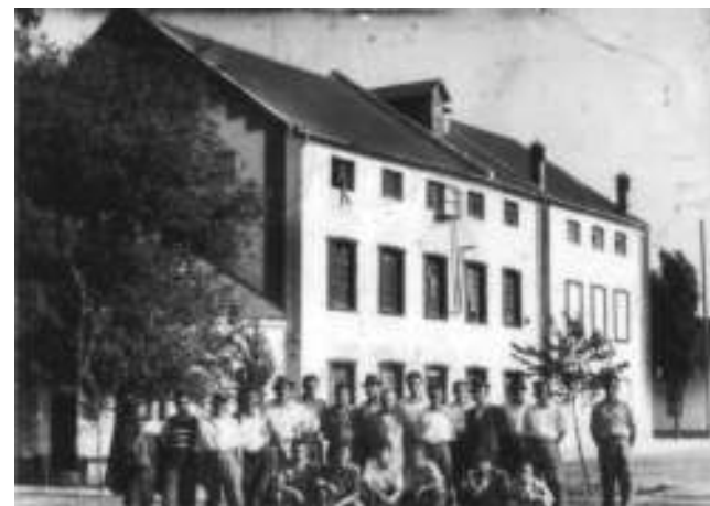
Млинари испред млина у Карлову