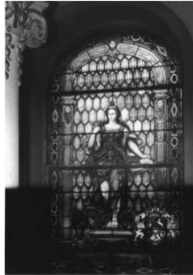
Вишраж на згради Жујаније у Зрењанину са грбом грофовске породице Карачоњи