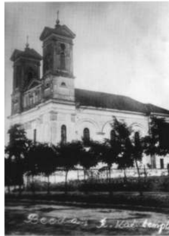
Римокатоличка црква у Беодри

(5) Никола Гаћеша - Аграрна реформа и колонизација у Банаџу 1919-1941. - страна 112.