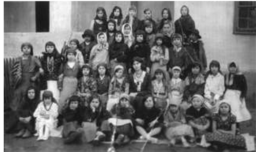
На фотографијама: Школска деца крајем шездесетих година