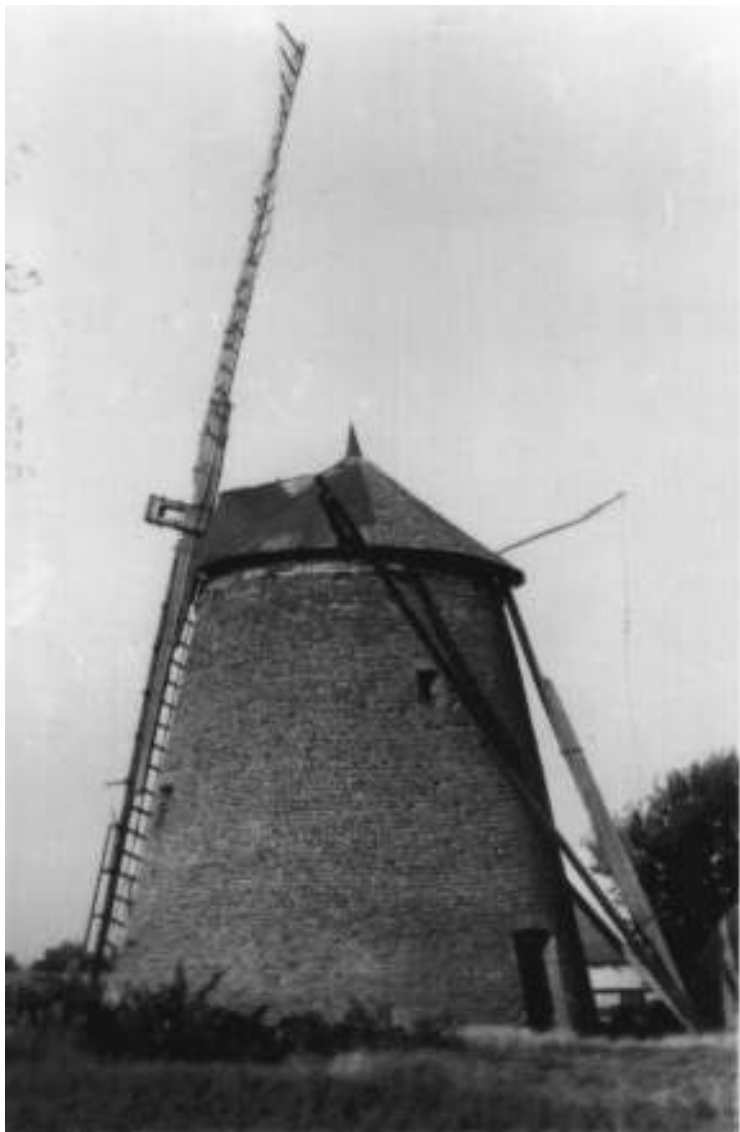
Последња вејрењача у Карлову пред рушење