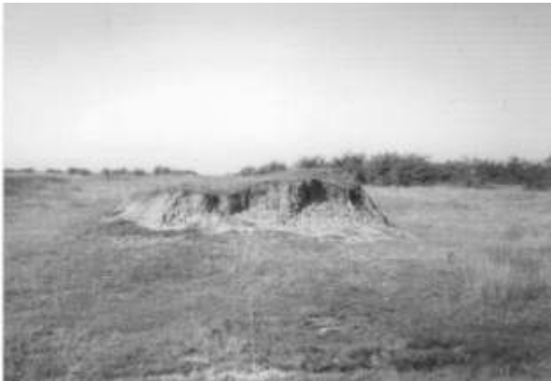
Данашњи изглед "вешала"