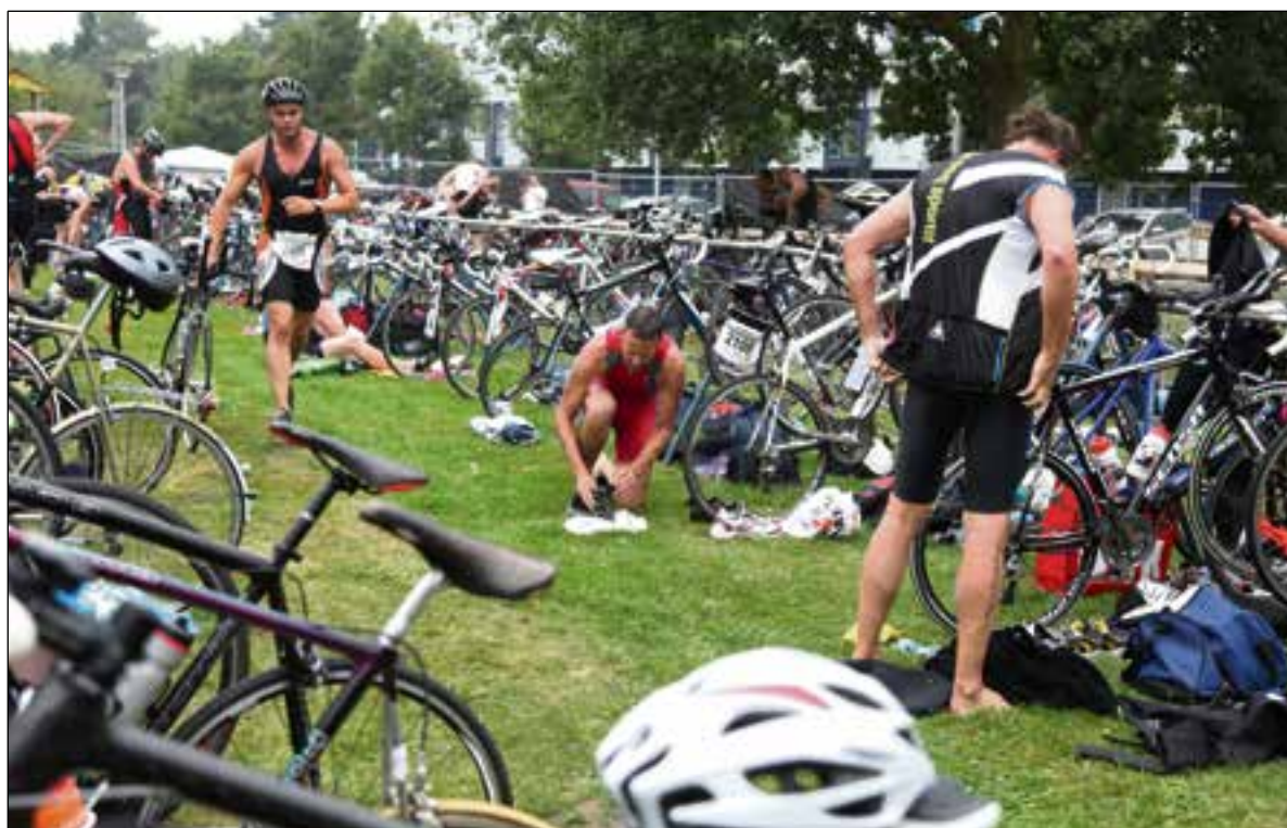
Bij zo'n triatlon komt nog heel wat kijken. Neem alleen al het wisselen.

Datzelfde gold na rust toen de FC Weesp-aanvaller wederom kon scoren en voor angstzweet zorgde bij de SO Soest-supporters langs de kant. Na de tweede tegentreffer zette SO Soest meer aan en kon het alsnog terugkomen. Na de 2-2 leken SO Soest en FC Weesp het wel te geloven en barstte voor SO Soest het feest los.