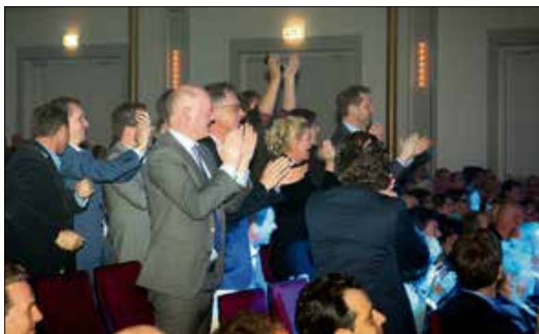
De medewerkers van Smit horen dat ze gewonnen hebben.

In deze door de provincie geïnitieerde verkiezing waren 300 bedrijven in de race, verdeeld over drie categorieën. In de categorie MKB Groot werd Smit & Zoon eerste. In de categorie MKB Midden reikte Solarclarity tot de top 10. Beide bedrijven waren al door de Weesper bedrijvenvereniging IVW uitgeroep-