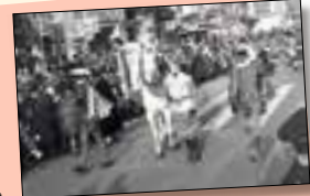
Sinterklaas en zijn Zwarte Pieten zijn al jaren welkomme gasten in Amsterdam.

Infiltreren Op zijn achtste ging Ton naar een andere... bij vrees dat vriendschap