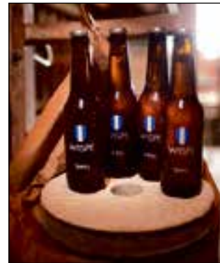
Het Weesper Wispe bier.

Stuur je antwoorden voor 21 mei naar cityquiz@wesopa.nl . Onder de inzenders van de goede antwoorden worden Wispe pakketten en City-vrijkaarten verloot.