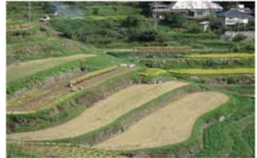
日本の棚田百選「北庄」（岡山県久米南町）