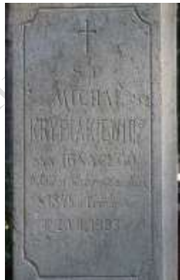
Nagrobek 21 – Rok 2015, 29 października. Lwów. Nagrobek Michała Nikodema Krypiakiewicza.