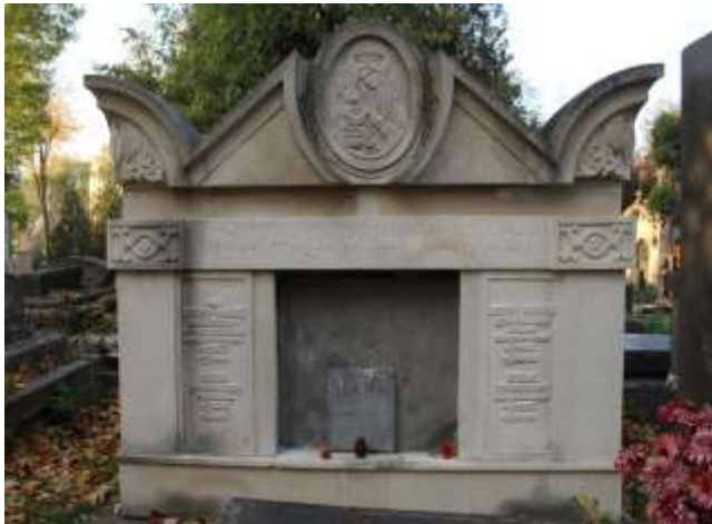
Nagrobek 22 – Rok 2015, 29 października. Lwów. Nagrobek rodziny Krypiakiewicz. Foto