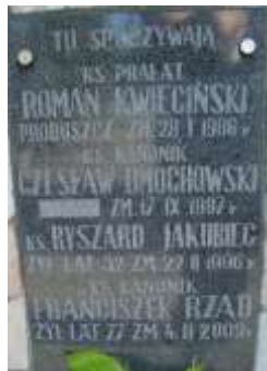
Zdjęcie 11 – Rok 2012, 30 września. Tablica informacyjna na cmentarzu w Janowie Lubelskim.

Zmarł 28 stycznia 1986 roku. Pochowany w grobowcu księży na cmentarzu w Janowie Lubelskim 767 .