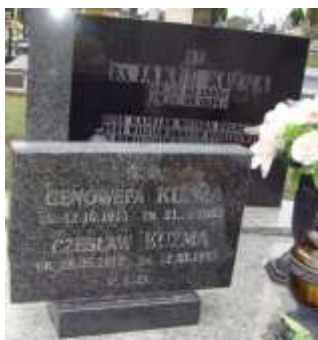
Nagrobek 31 – Rok 2012, 7 września. Nagrobek rodziny Kuźma.

Urodził się 24 lipca 1905 roku we wsi Płoskie 735 . Kapelan WP (rezerwa od 01.01.1939) Wikariusz parafii Skierbieszów (-1933), Lubartów (1933-1934), Wąwolnica (1934-1938). Więzień obozów hitlerowskich Oświęcim, Dachau. Do KL Auschwitz (numer więźniarski 16053) przybył 24 maja 1941 roku, w 1942 roku przeniesiony do KL Dachau. Zmarł 18 czerwca 1974 roku. Pochowany na cmentarzu w Sitańcu.