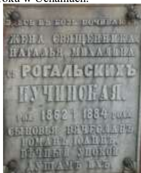
Nagrobek 27 – Rok 2007, 20 maja. Tablica nagrobna na cmentarzu w Uchaniach.