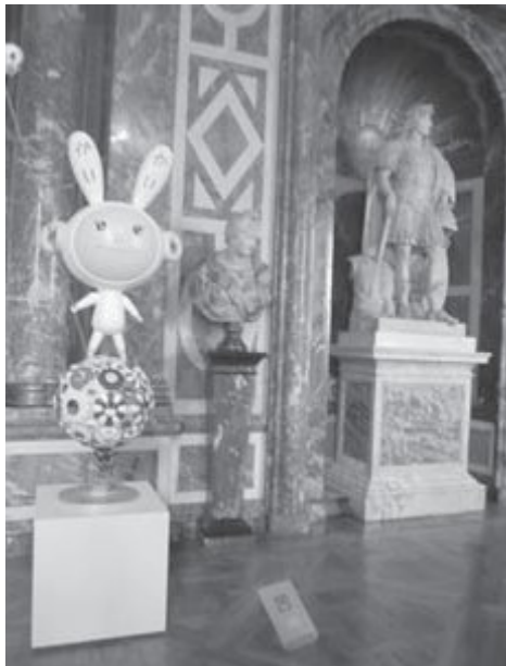
Илл. 3. Такаси Мураками. Кайкай, 2000–2005, живопись маслом, акрил, синтетическая смола, стекловолокно, железо, 220×75×50 см