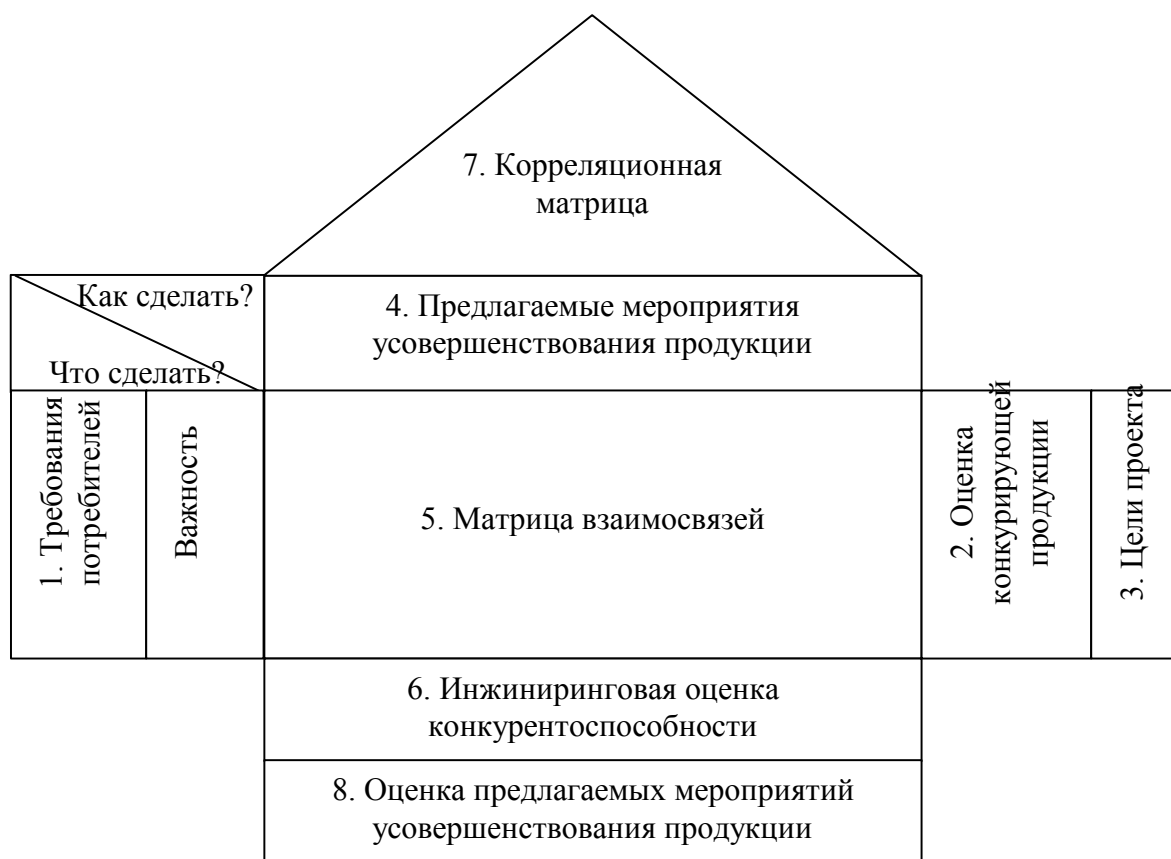
Рисунок 1. Структура «дома качества»

Алгоритм применения метода разворачивания функции качества состоит из восьми последовательных этапов заполнения «дома качества».