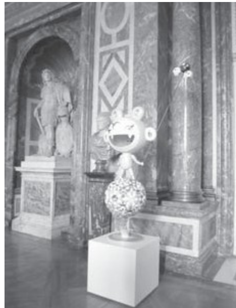
Илл. 4. Такаси Мураками. Кики, 2000–2005, живопись маслом, акрил, синтетическая смола, стекловолокно, железо, 220×75×50 см