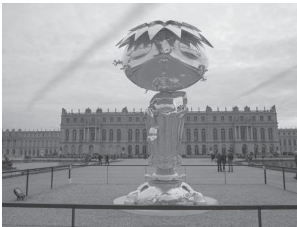
Илл. 5. Такаси Мураками. Овальный Будда, 2007–2010, бронза и сусальное золото, 568 × 312 × 319 см

Среди экспонатов выставки – концептуальный персонаж в поп-версии Мураками «Овальный Будда», который был представлен неоднократно и на предыдущих выставках, но в разном исполнении и разных размеров. Версальский «Овальный Будда» (Oval Buddha, 2007–2010, bronze et feuille d'or) (Илл.5), был выставлен перед развернутым зданием дворцового ансамбля в партере парка. Изображение Будды не следует канонам, это вольная, игровая интерпретация: стилизованная двуликая фигура, с поджатой левой ногой сидящая на постаменте в виде граненого бокала. Мураками изображает Будду в виде огромного Покемона (вымышленного персонажа), озорно наделив его двумя лицами: одно задумчивое с небольшой бородкой, напоминающее самого художника, а другое с огромным пугающим ртом с острыми зубами. Сверкающая фигура впечатляющих размеров Овального Будды аккумулирует в себе отсылки и к буддийскому искусству, и к западной традиции, что свойственно художественной манере Мураками. Весь облик этой скульптуры напоминает скорее елочную игрушку, настраивает на игровой лад.