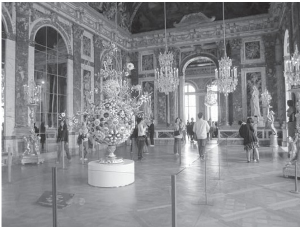
Илл. 1. Такаши Мураками. Цветок Матанго. 2001–2006, стекловолокно, живопись маслом, акрил, металл, 315×204,7×263 см