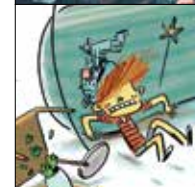
עמר הופמן הסיפור על יואב ששלח את המשפחה שלו בדואר