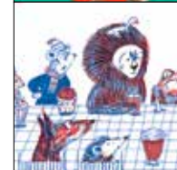
נעמה בנזימן נוני ונוני יותר