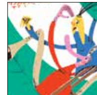
ענת ורשבסקי זרבבל זלפה