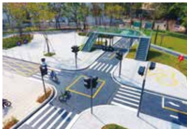
景田北七街交通主题公园

公园是城市居民联系自然的通道，而社区公园作为家门口的公园，是居民使用最频繁的一类公园，与人们的生活联系最紧密。