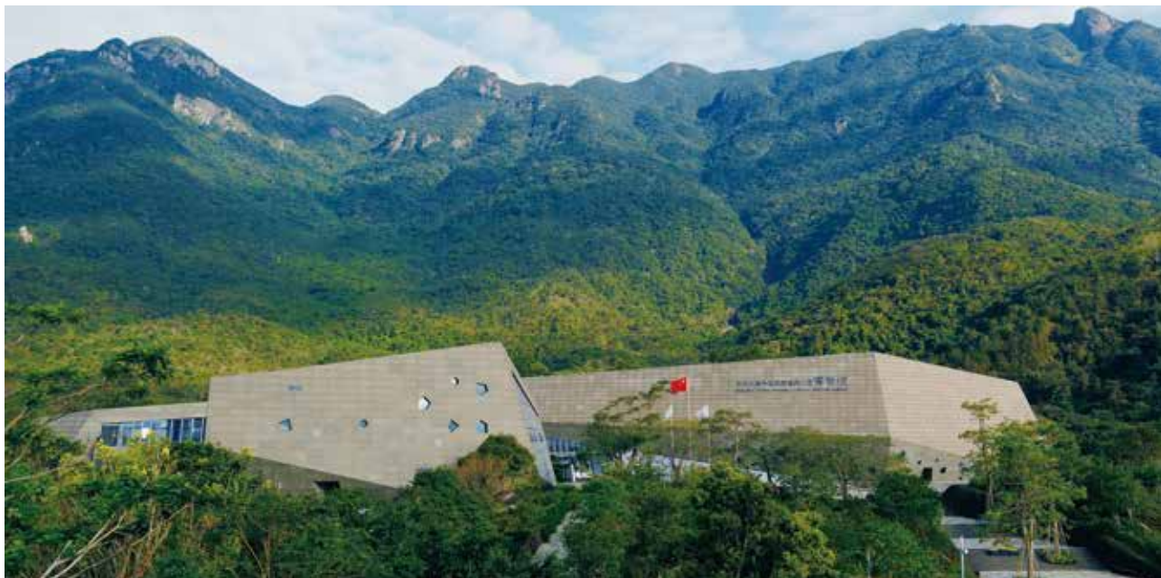
大鹏半岛国家地质公园

设，要制定科学的城市森林发展规划，加强与园林、农业、水利、环保等相关部门的协调与合作，落实各项城市森林建设工程；加强城市森林科学研究与技术创新，有效解决制约深圳城市森林发展的技术“瓶颈”；加强林业、绿化政策法规和执法队伍建设，巩固森林城市建设成果；发挥市场经济的活力，调动全社会参与生态建设的积极性。