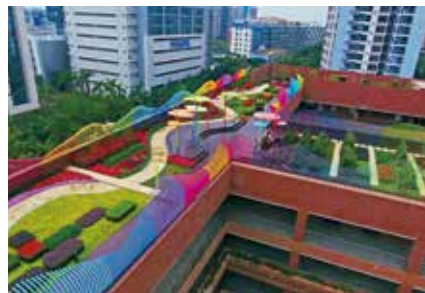
福苑小学屋顶花园

近年来，福田区抢抓粤港澳大湾区建设契机，以提升福田“城市会客厅”品质为目标，以构建市民、城市、生态相融相长为路径，重构空间布局，精雕细琢城市环境和公共空间，短短10年间，公园建设实现了从少到多、从粗放到精细的飞跃发展，建成公园128个，总面积878.93公顷，公园总数和密度位于全国同类中心城区前列，“百园福田”也成为了福田区的一张“金字招牌”。