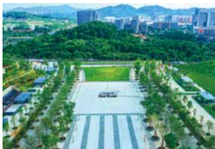
光明高新园区城市广场

预计到2020年底，光明区将建成公园254个，人均公园绿地面积35.37平方米，达到“500米到达社区公园、1公里到达城市公园、5公里到达自然公园”总体目标，基本建成全域式、立体化“公园之区”，实现“进光明就是进景区”。