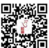
美丽深圳志愿者 平台二维码