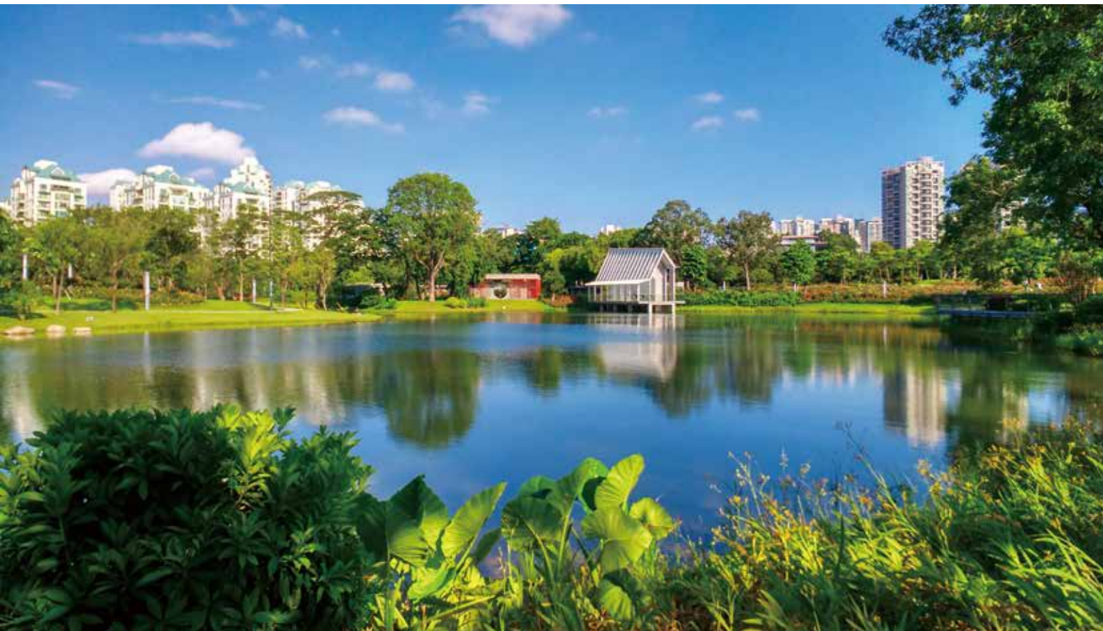
花蜜湖、中西式婚礼堂