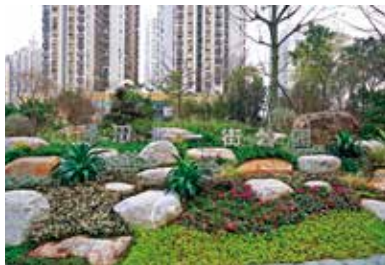
景田北一街岩石主题公园

公园是城市居民联系自然的通道，而社区公园作为家门口的公园，是居民使用最频繁的一类公园，与人们的生活联系最紧密。景田北社区公园群是福田区率先打造的全市首个“公园城市”理念的社区公园群，总体规模全市最大、主题最全、生态最优。