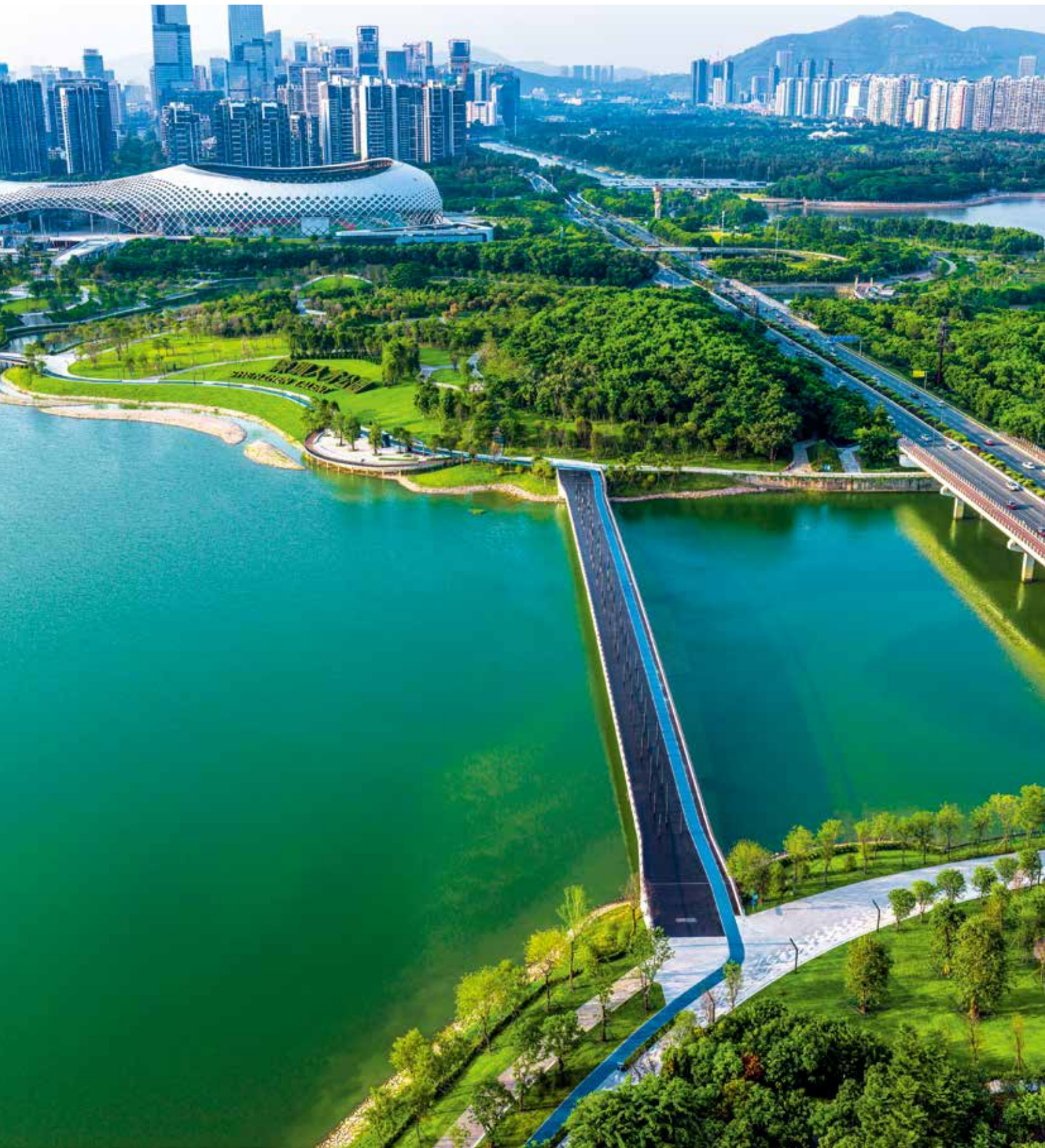
深圳人才公园