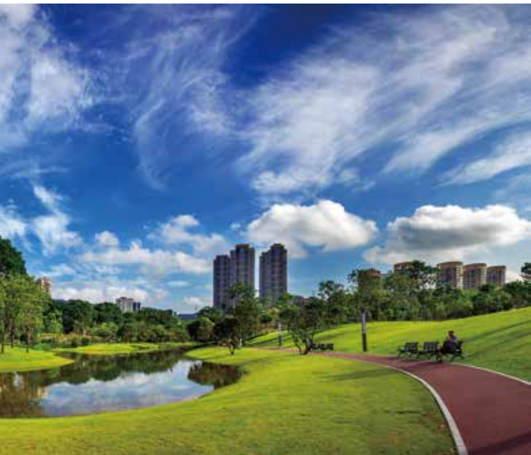
香蜜公园休闲步道

功能最多彩。 园内建设自然展厅、花卉博览园、活动中心、天然书吧、艺术长廊等配套建筑，特色鲜明，风格迥异，聚集人气和活力；布局的生态水系、慢行系统、栈道系统、活动广场等，体验内容丰富，休闲要素完备，为市民提供多彩的娱乐空间。特别是打造极具特色的中西婚殿堂，中式婚礼堂运用层叠迂回、欲扬先抑的中国园林造园构景手法，西式婚礼堂建筑采用西方礼拜堂简洁尖顶的空间原型，每天吸引大量情侣来此拍摄婚纱影集，成为广大情侣心中的婚恋圣地。同时，公园多样的功能布局，与周边环境形成良好的生态交互和更新，提升了区域集聚和辐射能力。