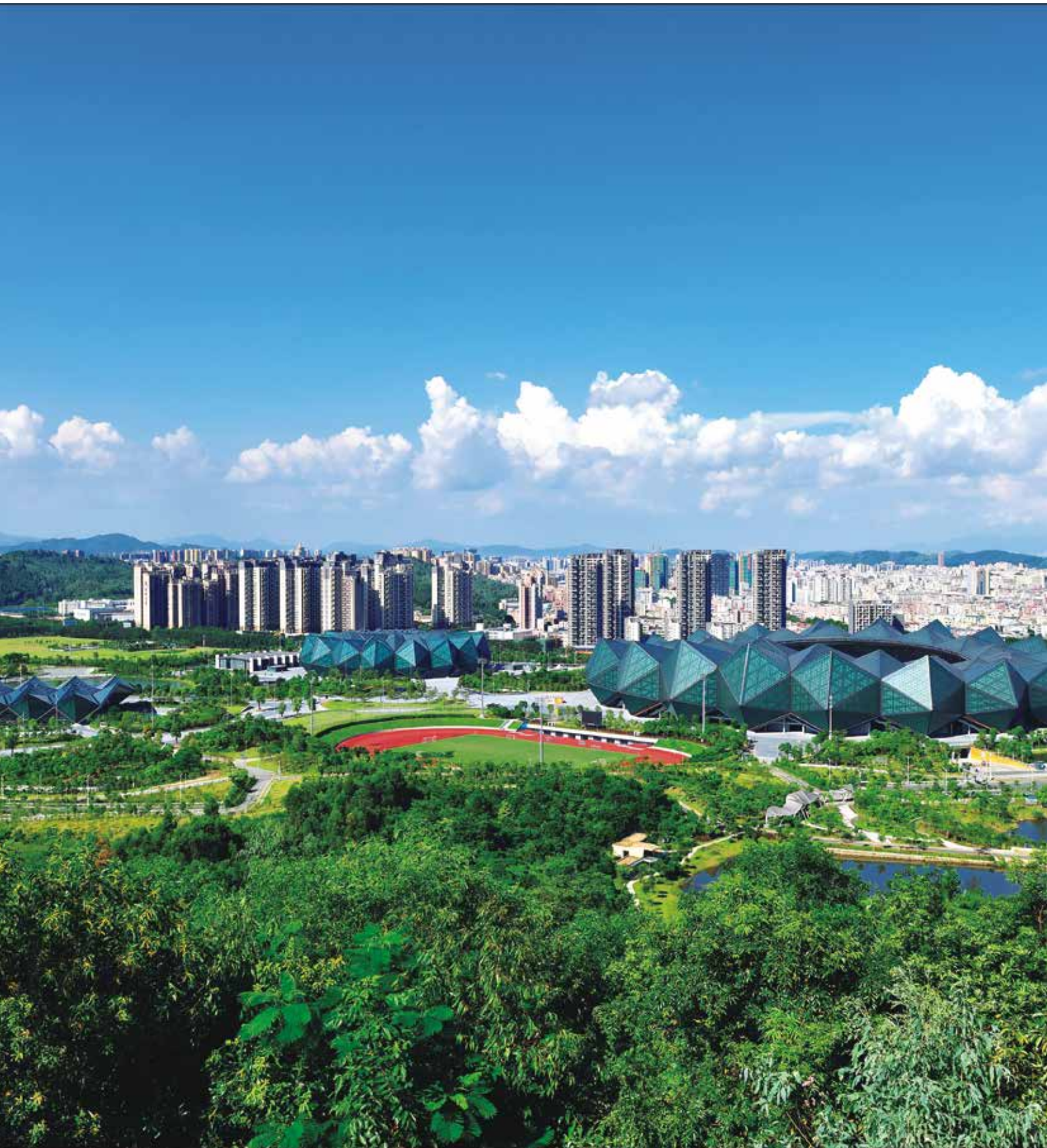
大运公园