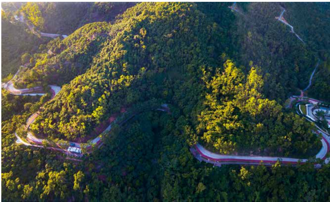
山峦绿道横空出世

角国家森林城市群建设总体规划，围绕推进深圳市关于未来发展的战略部署，通过实施生态环境、生态文化、生态经济、创新驱动和安全保障等五大体系建设，进一步完善城市森林网络，进一步扩大森林湿地面积，进一步提升森林资源质量，进一步营造多彩森林景观，进一步增加居民生态福利，进一步传播森林生态文化，让深圳的绿水青山变成助推创新发展的金山银山，把深圳建设成为与现代化国际化创新型城市地位相匹配的国际一流森林城市。