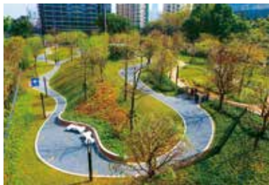
景田北六街宠物主题公园