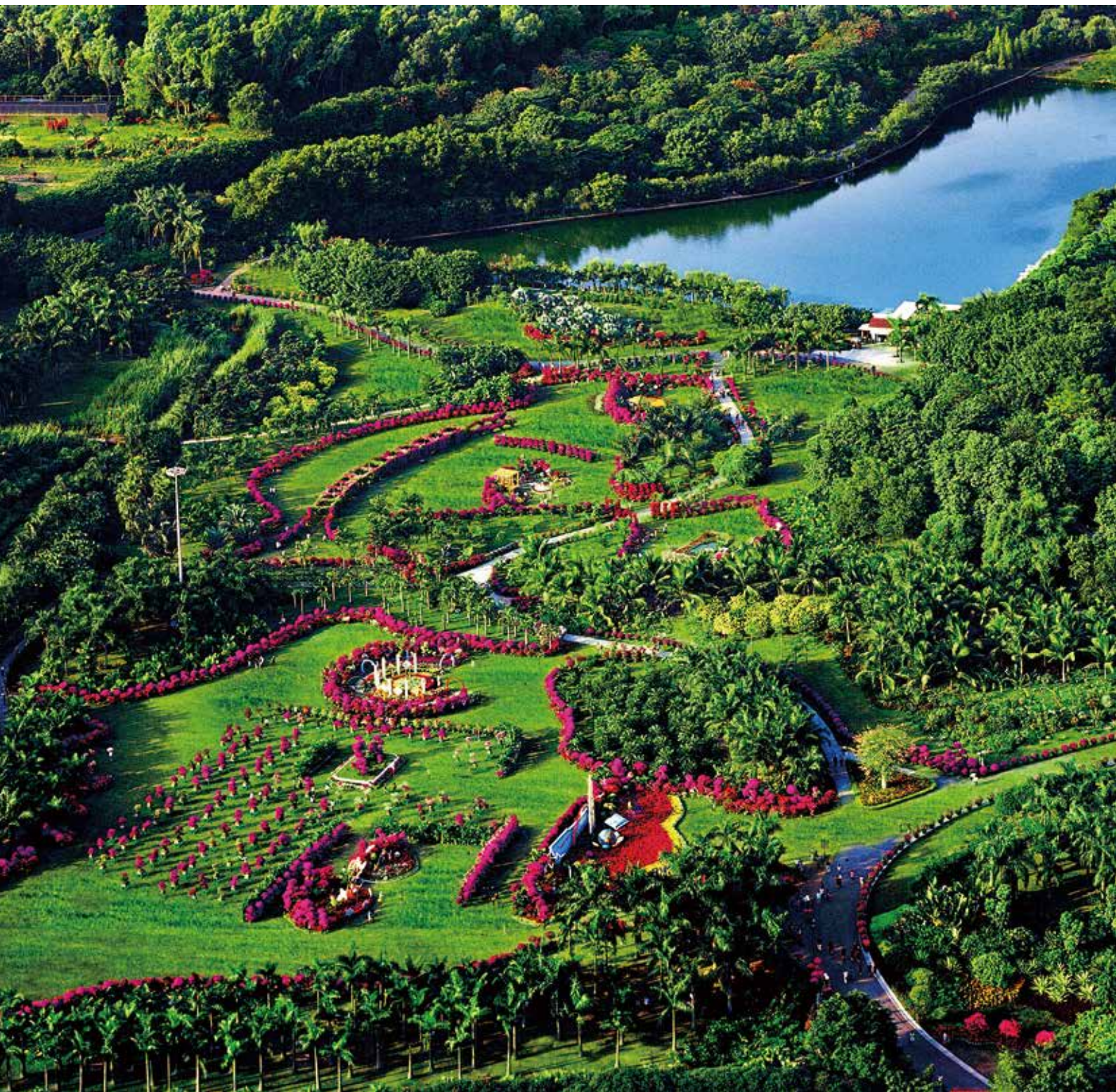
莲花山公园