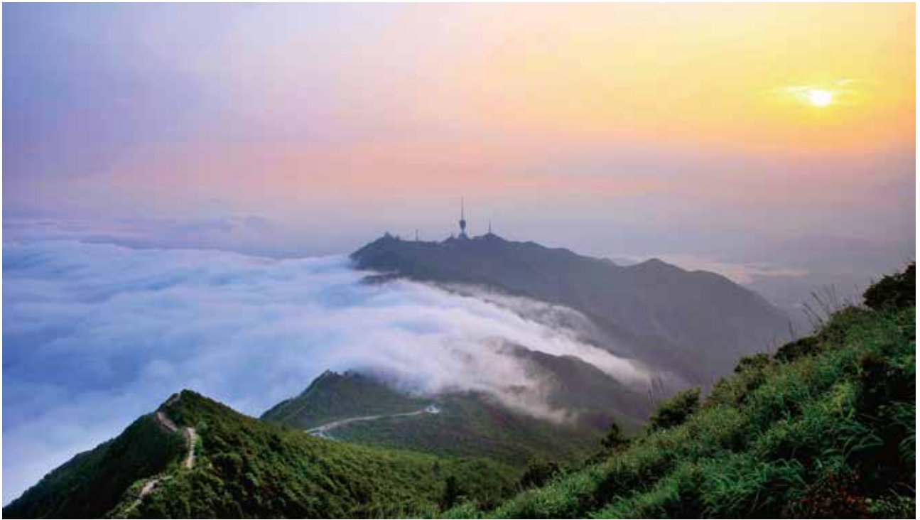
梧桐山夕照全景

标，因地制宜，大胆创新，紧扣“生态化，人文化，均衡化，特色化”指导策略，大力推进公园、花漾街区和街心花园建设提升，构建以市民需求为导向的优质公园体系。同时结合梧桐山、梅沙湾的得天独厚的山海特色自然资源，注重公园特色塑造，不断丰富文化内涵，初步形成了功能配套齐全、景观形式与艺术风格多姿多彩的城市公园特点。其中梧桐山国家森林公园因“金钟花”“毛棉杜鹃”特色植物闻名遐迩；中央公园错落有致、布局大气、造型精巧，是深圳地区的园林经典；大梅沙海滨公园成为集体休闲度假、观光旅游、运动娱乐为一体的旅游胜地；海山公园依山而建，顺势而为，既劈