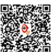
深圳市城市管理局 微博二维码