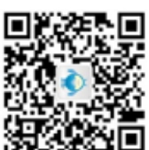
深圳市城市管理局 微信服务二维码