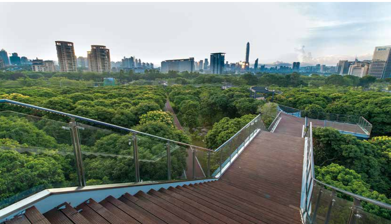
栈道上俯瞰荔枝林

建成后的香蜜公园园内呈现风格多样的特色建筑、绿意葱茏的植物地被、花开四季的花卉种植、充满活力的休闲设施，移步换景、花香蜜语，打造优美怡人的环境典范，被市民广泛赞誉“最美公园”。