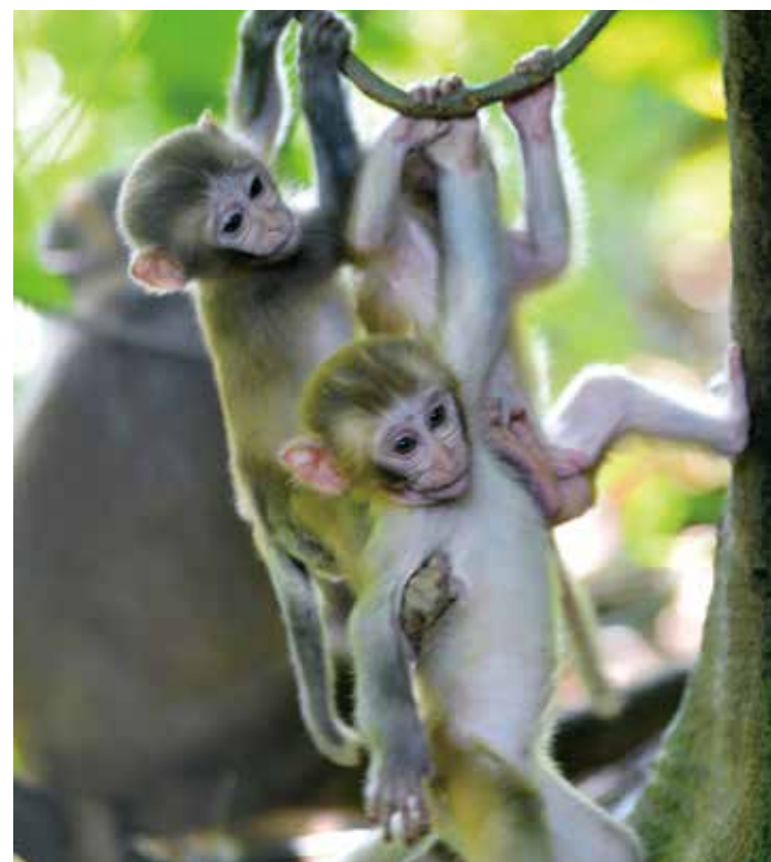
内伶仃岛上的猕猴

公园之城的优美画卷已经展开。全市上千个公园在深圳约2000平方公里的土地上星罗棋布，像一颗颗绿色明珠，构成了深圳最重要的自然生态系统，铺就了深圳市民宜居宜业的最美底色。