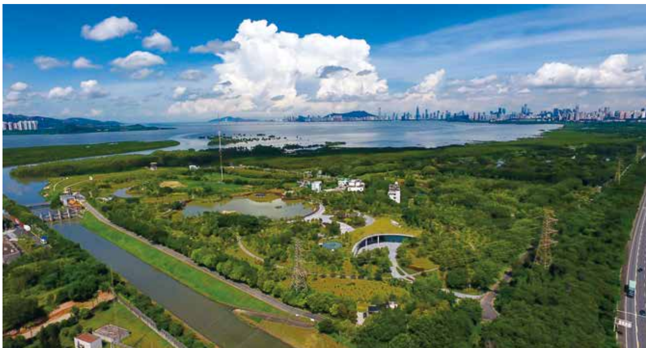
福田红树林生态公园

福田借鉴纽约中央公园等世界著名公园建设经验，高起点、创造性开展公园建设，形成以“市政公园+社区公园+绿化公园带”为框架的公园集群，“百园福田”成为深圳中心区一张金字招牌，其中打造“没有围墙的公园”“公园与市政绿道自然连续”等造园新理念应用取得明显成效。“香蜜公园”就是深圳市政公园建设的质量典范、生态典范、环境典范，日均接待市民和游客约1.5万人次，被市民亲切地称为“最美公园”和深圳“当红打卡点”。