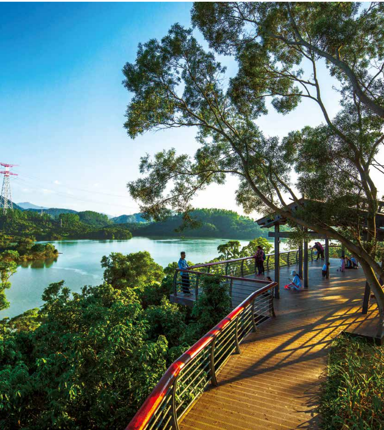
揽尽秋色入画来