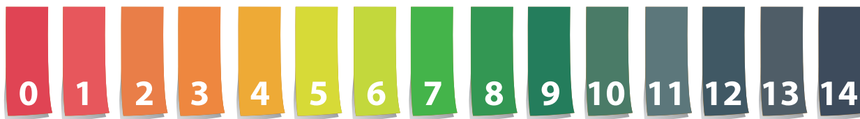
Scala dei valori di pH