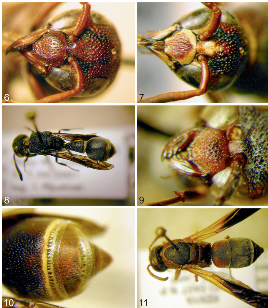
Abb. 6-11: (6) Afrepipona unifasciata nov. sp. ♀ Clypeus; (7) Afrepipona unifasciata nov.sp. ♂ Clypeus; (8) Pseudonortonia madacassa nov.sp. ♀ Habitus; (9) Pseudonortonia madacassa nov.sp. ♀ Clypeus; (10) Pseudonortonia madacassa nov.sp. ♀ 3. Tergit; (11) Knemodynerus dancaliensis (GIORDANI SOIKA) ♀, Habitus.