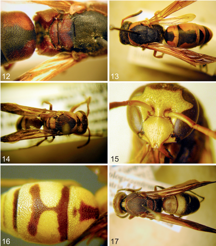
Abb. 12-17: (12) Knemodynerus danicaliensis (GIORDANI SOIKA) ♀, Propodeum; (13) Knemodynerus dictatorius (GIORDANI SOIKA) ♀, Holotypus; (14) Pseudepipona bella nov.sp. ♀ Habitus; (15) Pseudepipona bella nov.sp. ♀ Clypeus; (16) Pseudepipona bella nov.sp. ♀ 2. Tergit; (17) Anterhynchium uniforme nov.sp. ♀ Habitus.