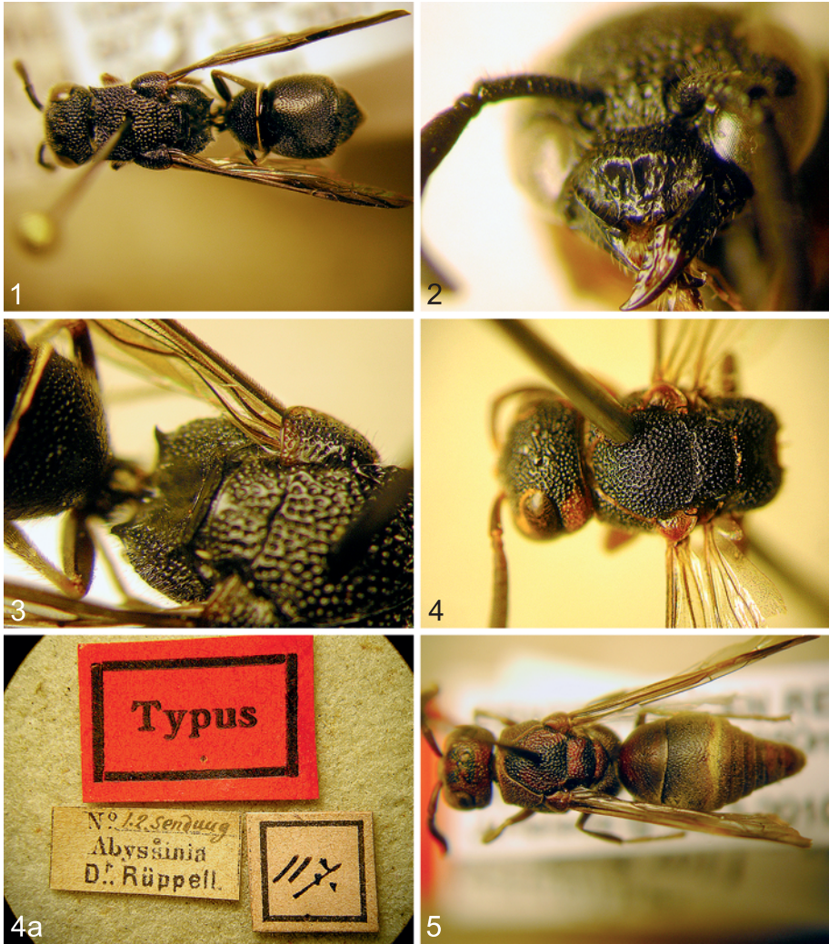
Abb. 1-5: (1) Alastor nigrinus nov.sp. ♀ Habitus; (2) Alastor nigrinus nov.sp. ♀ Clypeus; (3) Alastor nigrinus nov.sp. ♀ Propodeum; (4 und 4a) Afrepipona angustata de SAUSSURE ♀ Holotypus; (5) Afrepipona unifasciata nov.sp. ♀ Habitus.