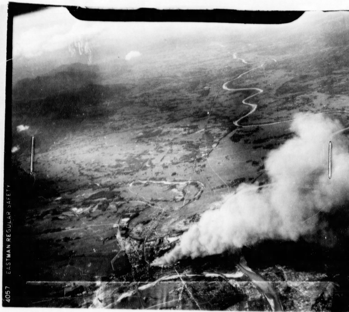
Fires set in ICHINOSEKI Ichinoseki Town, Sendai Area, 10 August 1945.