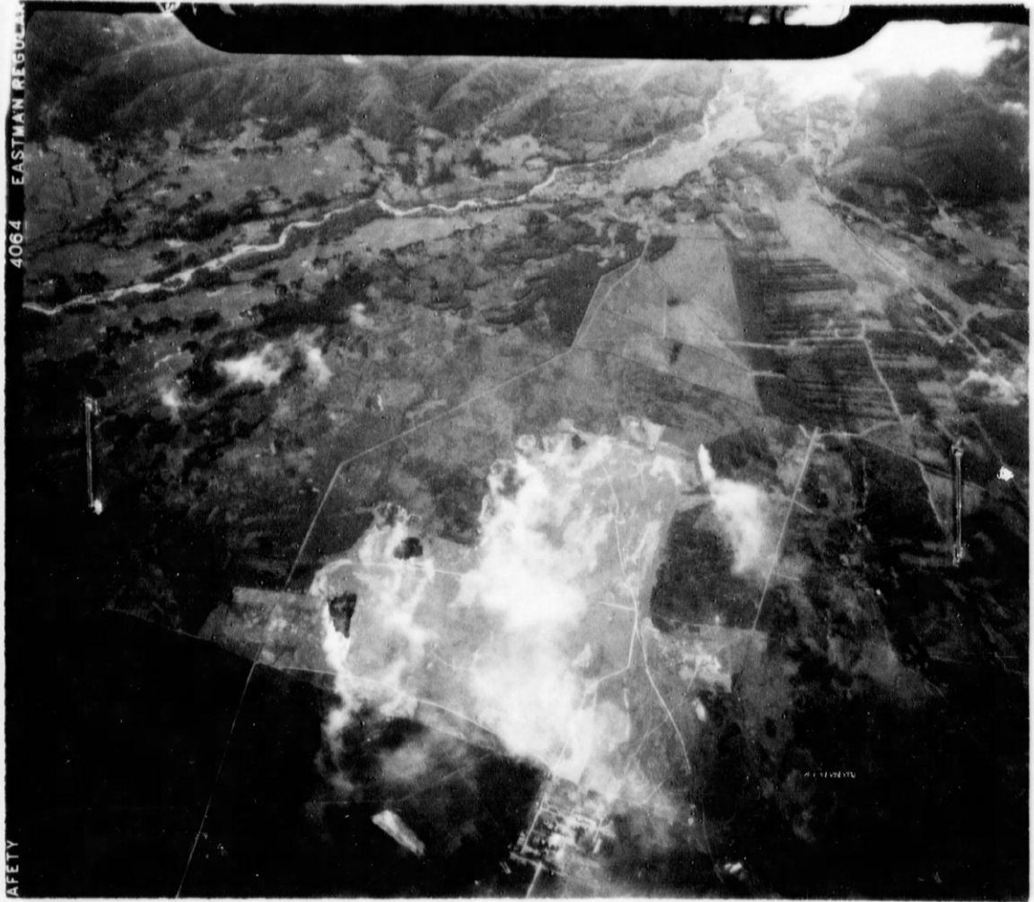
Fires on A/F believed IWATE (GOTONO) 39^{\circ} 20' N. 141^{\circ} 10' E. , North Honshu, 10 August 1945.