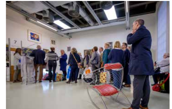
Tussen Kunst & Kitsch. Fotografie: Roel Dijkstra

de waarde van de meegebrachte werken bepalen. Er werden mooie vondsten gedaan en in september was de televisie-uitzending.