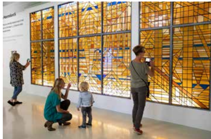
Werk van Jacoba van Heemskerck in de tentoonstelling Meesterlijke vrouwen .

De kunstwereld is nog altijd een jongensclub. Slechts 13% van de kunst in Nederlandse musea is gemaakt door vrouwen, blijkt uit onderzoek van Mama Cash. Hoe beroemd sommige vrouwen ook waren, na hun dood werden ze uit de kunstgeschiedenis geschreven. Een flink aantal raakte in vergetelheid. De tentoonstelling Meesterlijke vrouwen bracht daar verandering in. Daar was 100% vrouw. Deze