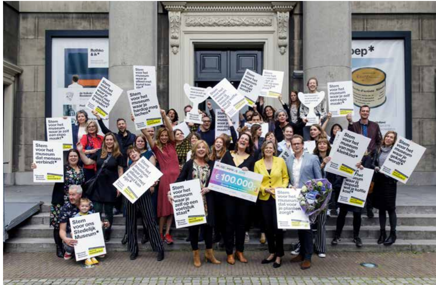
Het museum wint de BankGiro Loterij Museum Prijs 2019.

Het is in deze tijden van de coronacrisis je opeens nauwelijks meer voor te stellen: een museum vol leven. Nu thuis werkend denk ik met weemoed terug aan 27 december 2019, toen ik me in een hoekje van onze entree nestelde. Er kwamen die dag 368 bezoekers binnen. Je kon zien dat veel mensen zich in de sfeervolle kapel snel ontspanden, niet in het minst door de hartelijke ontvangst door de vrijwilligers en gastvrouwen. Het publiek kwam vaak voor één van de programma's, voor de mode en kunst in Modest Fashion , de collages van de Verbeke Foundation, de kerstschilderijtjes van Rien Poortvliet, om even alleen te zijn met Rothko of voor het Modeltrein Kerstfestijn . Maar daarna zwierven ze geïnteresseerd door de andere zalen, knutselden een kerstkaart op zolder, een treinwagonnetje in het souterrain of hingen een herinnering aan een dierbare in de kerstboom op het plein. Dit was een dag waarop het museum was zoals ons dat voor ogen staat: huiselijk, de wereld en de stad verbonden, met voor elk wat wils en vol mogelijkheden tot ontmoeting, reflectie en creativiteit.