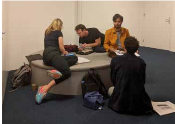
Jonge kunstenaars tijdens een activiteit rond de Volkskrant Beeldende Kunst Prijs.

en visie, waren er speeddates met kunstprofessionals en stond op de publieksdag de vraag centraal; voor wie maakt de kunstenaar zijn kunst?