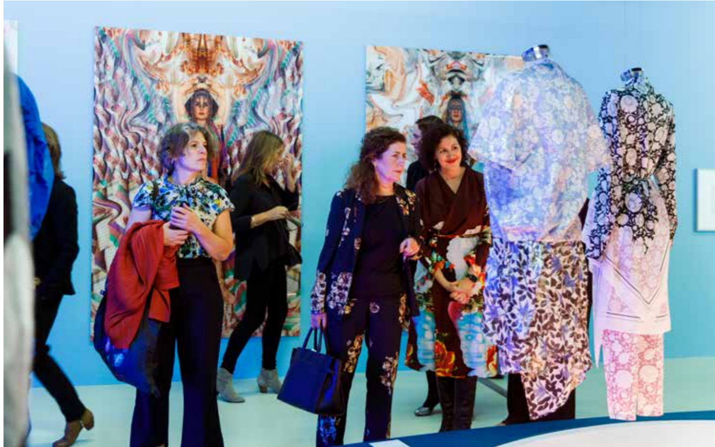
Modest Fashion.