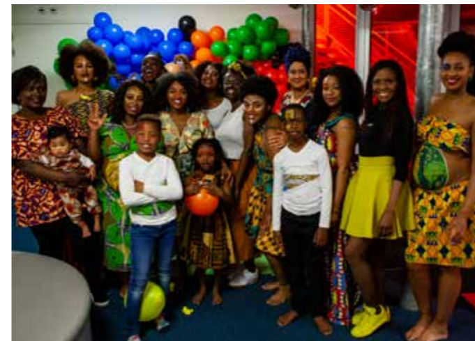
De Bellypaint Art & Fashion crew.

Afgelopen jaar hebben we vrijwel elk verzoek tot samenwerking gehonoreerd. Daarmee verbreedden we ons netwerk nog meer en lieten we zien wat Mijn Schiedam is en kan zijn. Van een Afrikaans mode- en kunstfeest ter ere van de zwangere vrouw, tot een Iftar (ramadan-maaltijd) en van een fantastisch modeltreinen kerstlandschap tot bokswedstrijd, van een tentoonstelling van twee scholieren tot een herinnerboom met de lokale uitvaartbegeleiding. Een overzicht hiervan vindt u in bijlage 2. In bijlage 1 kunt u lezen dankzij welke mensen al deze activiteiten werden gerealiseerd.