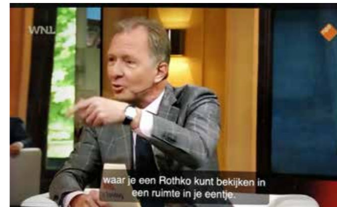
Presentator Rick Nieman over ons museum waar je een Rothko kan bekijken.

In 2019 kwam het museum twee keer in het televisieprogramma van Jinek, onder andere met de Plantvakantie. Ook was het museum met de tentoonstelling Rothko & ik op televisie. Tijdens een interview met een psychologe vertelde presentator Rick Nieman over het schilderij van Rothko waar je in je eentje naar mocht kijken.