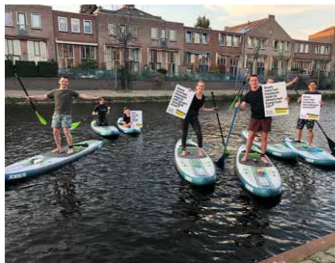
WhaSUP steunt ons