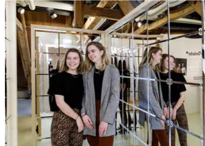
Isa en Lisa kozen werk uit voor de tentoonstelling Post/Delete .

Mijn Schiedam is dus inmiddels een jaar op weg. We hebben veel geëxperimenteerd en geleerd. We zijn onderdeel van de OF/BY/FOR ALL beweging.