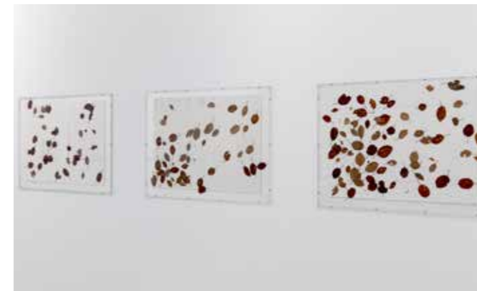
herman de vries, 1, 2 en 3 uur onder mijn appelboom, 1975, collectie Stedelijk Museum Schiedam

Het museum heeft in 2019 dankzij de subsidie van de gemeente, een bijdrage van het Mondriaan Fonds en steun van de Vereniging Rembrandt, de verzameling kunnen verrijken met 24 aankopen. Daarnaast zijn er particulieren die kunstwerken of historische voorwerpen aan het museum schenken. Zo zijn er in 2019 in totaal 35 nieuwe objecten in de collectie opgenomen: 9 daarvan werden geschonken, 2 in langdurig bruikleen gegeven en 24 stukken werden aangekocht (waarvan 6 voor de NOG Collectie).