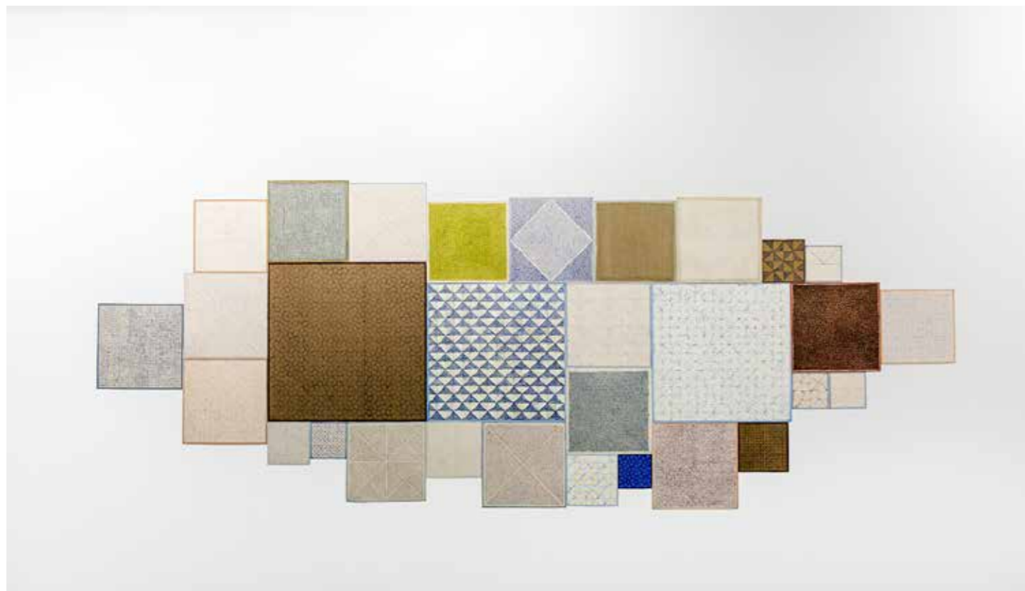
Fatima Barzge, Study of Square/Zamzam, 2017. Aankoop collectie NOG.