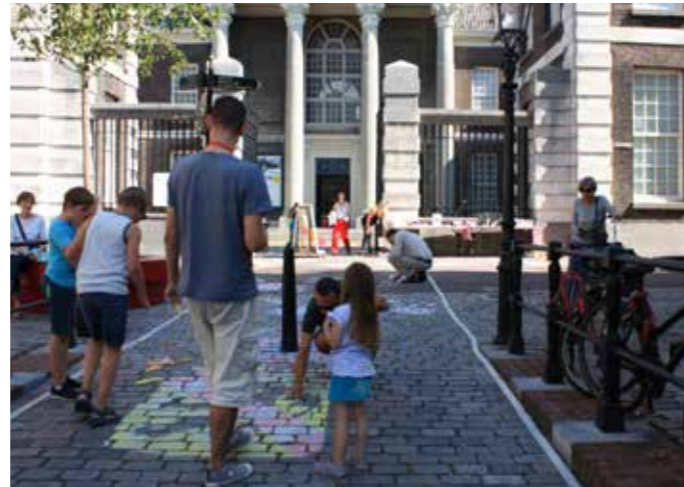
Grootste stoepkrijttekening van Schiedam.

van Schiedam. Ook werd er i.s.m. Centrum Management Schiedam en ondernemers op de Hoogstraat een boekje gemaakt met tips om te winkelen in de Hoogstraat. Dit boekje werd uitgedeeld aan alle museumbezoekers en was verkrijgbaar bij de ondernemers.