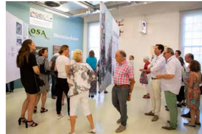
Bezoekers herkennen zich in de tentoonstelling In de Hoogstraat .

En bijna precies in het midden ligt het Stedelijk Museum Schiedam. De straat staat symbool voor veel winkelstraten in Nederland waar schaarste en overvloed, trends en tradities hun sporen na lieten. Het museum zette de straat in de spotlights met de tentoonstelling In de Hoogstraat . Verhalen uit een winkelstraat. Bijzonder was dat het publiek de tentoonstelling zelf kon aanvullen met foto's en andere spullen die aan de Hoogstraat herinneren. Speciaal voor deze tentoonstelling maakte kunstenaar Erik Mattijssen een tekening van 7.5 bij 3 meter. Bijna alles wat hij tekende, komt van de Hoogstraat, van drankfles tot dildo.