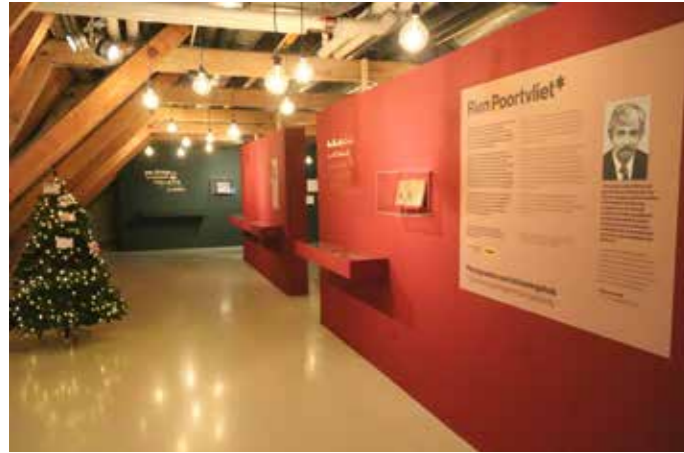
Kerstgroeten voor het koningshuis van Rien Poortvliet.

'Koninklijke Hoogheid, In plaats van een "hertje in de sneeuw" (dat ook erg mooi kan zijn!) heb ik voor U, omdat U zo dol op olifanten bent, een "olifantenwens" gemaakt'. Dat schrijft Rien Poortvliet op het schilderijtje dat hij in 1969 als kerstgroet stuurt aan prins Bernhard en koningin Juliana. Het werd het begin van een reeks kerstgroeten die hij elk jaar met de post verzond. Al die 24 schilderijtjes uit de collectie van het Koninklijk Huis waren rond de kerst te zien.