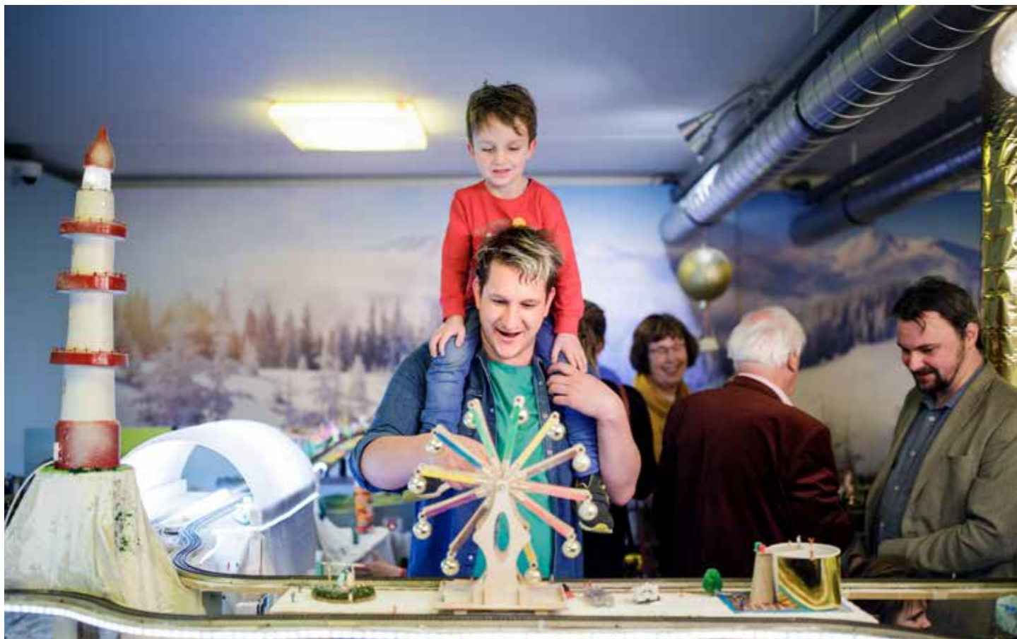
Modeltrein Kerstfestijn.