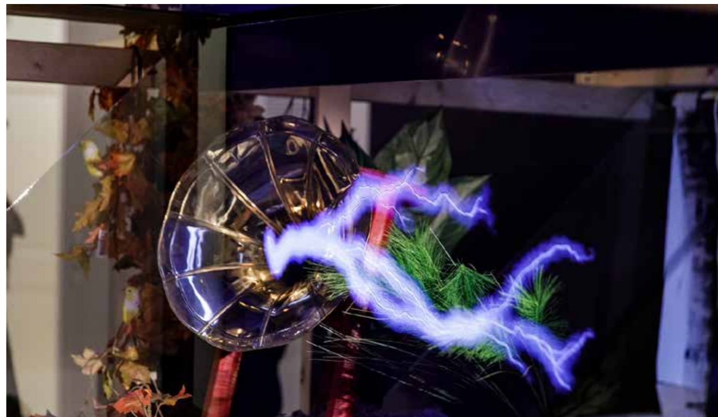
Installatie (detail) van Funda Gül Özcan.