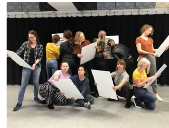
De Stokerij steunt ons