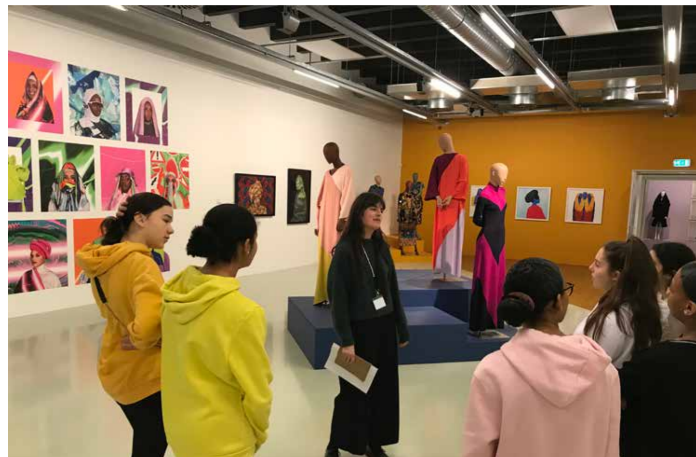
Leerlingen van het voortgezet onderwijs krijgen een rondleiding bij de tentoonstelling Modest Fashion .