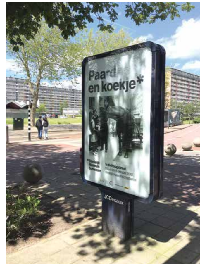
Paard en koekje, affiches in Schiedam voor de tentoonstelling In de Hoogstraat .