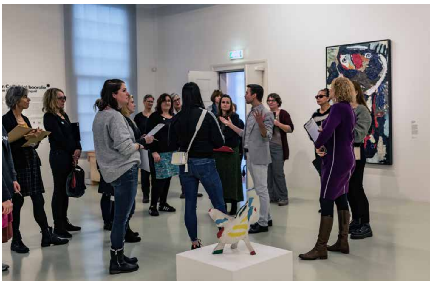
Leerkrachtensessie, samen met Mooi Werk.

De museumgidsen op zaal stonden op woensdag, zaterdag en zondag klaar op zaal voor een persoonlijke ontvangst. Ze gaven achtergrondinformatie over het museum, de kunstwerken en de tentoonstellingen.