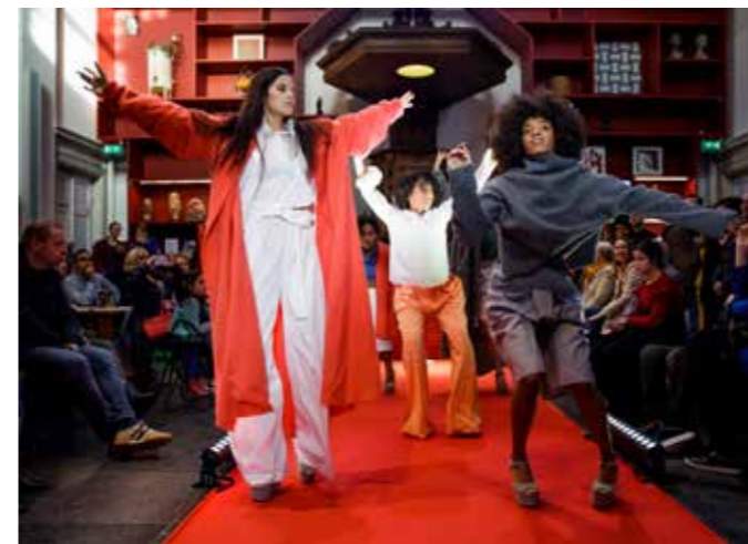
Modest Fashion Fair.