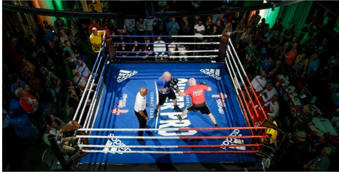
Boksvereniging De Haan Memorial weekend.