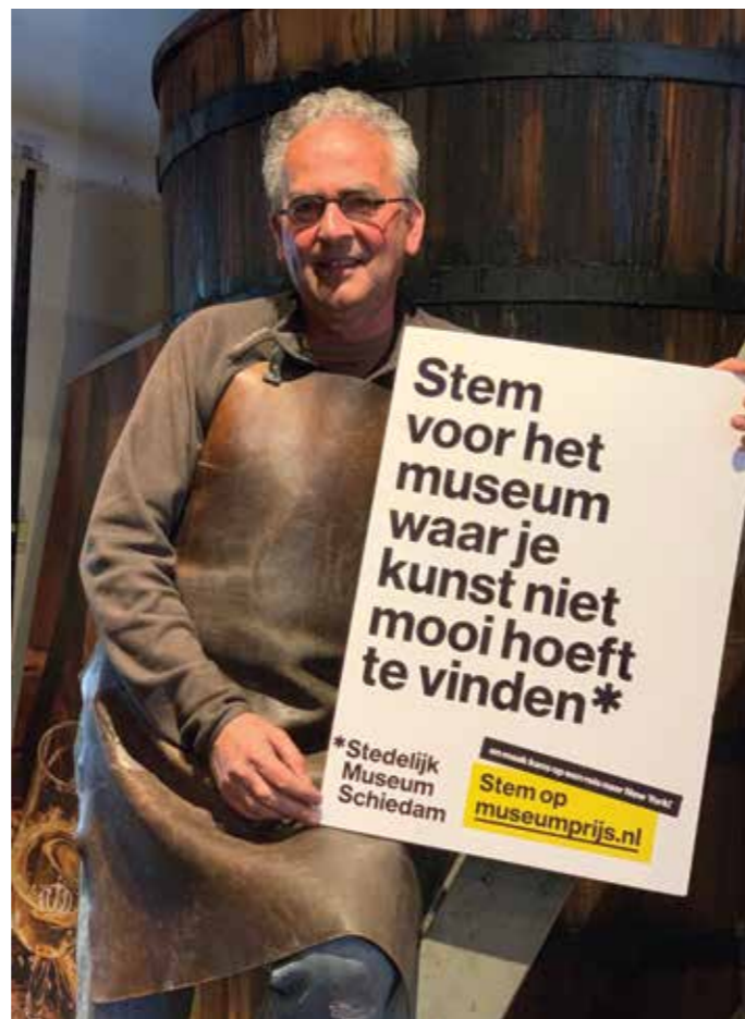
De brander van het Jenevermuseum steunt ons.