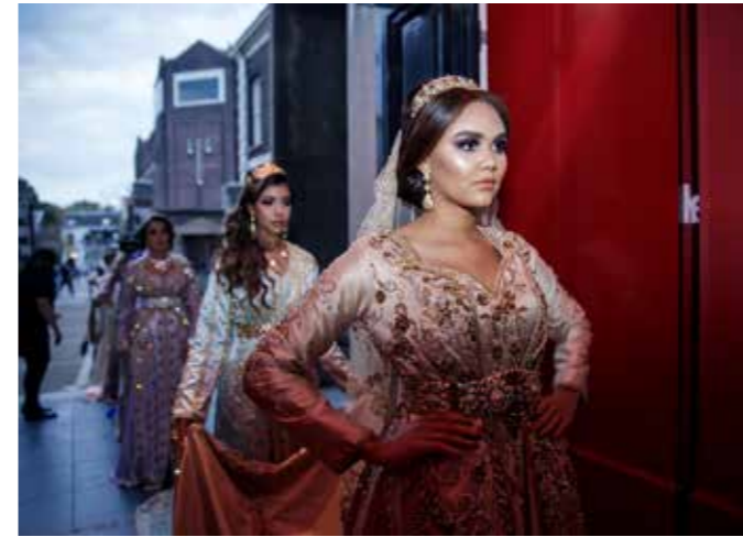
Modest Fashion Fair.