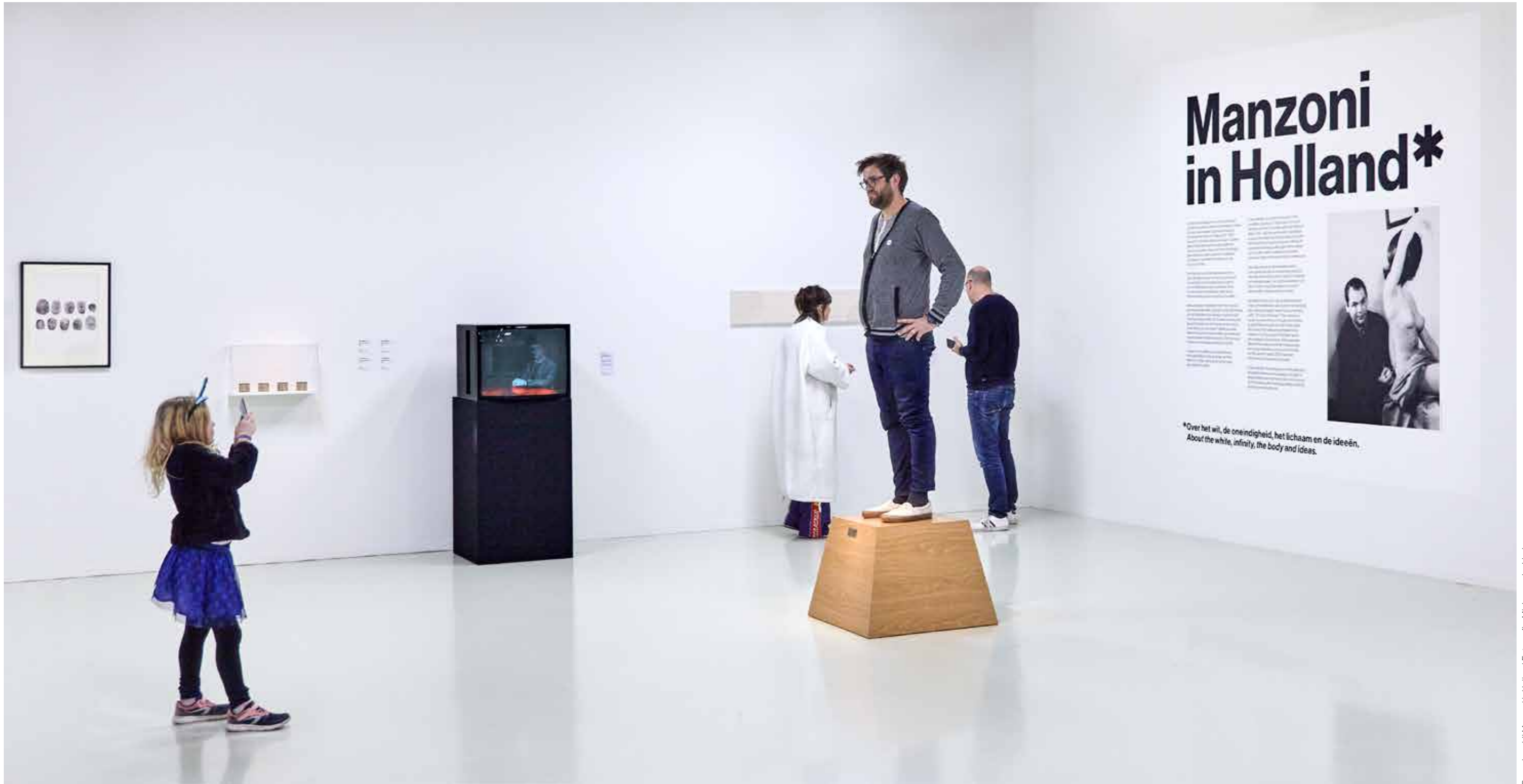
Bezoekers bij Manzoni in Holland