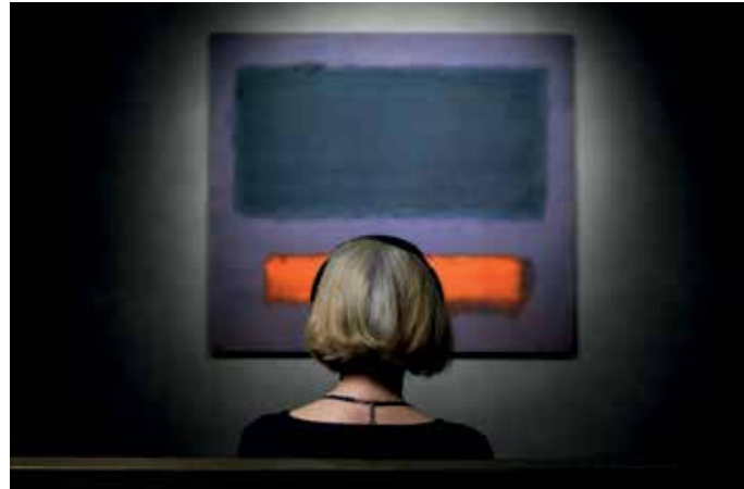
Rothko & ik.

In musea staan vaak drommen mensen voor zijn schilderijen. Hoe is het om er helemaal alleen voor te staan? Bij de tentoonstelling Rothko & ik kon je dat zelf ervaren. Je mocht in je eentje zonder telefoon één van zijn topstukken bekijken, het schilderij Grey, Orange on Maroon, No. 8 uit 1960. Niets of niemand stond het intieme moment met het schilderij in de weg. Het was Rothko & ik .