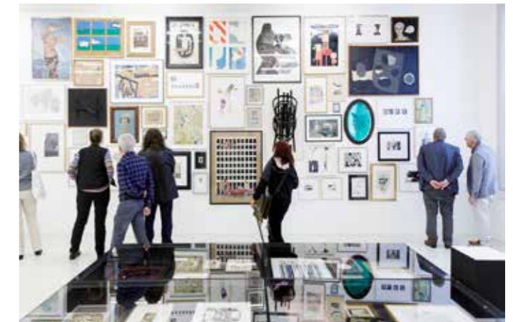
Magische collages.

In Magische collages werden collages getoond uit de collectie van Geert Verbeke en Carla Lens. Zij brachten hun collectie onder in hun private Stichting de Verbeke Foundation in het Vlaamse Kemzeke. Wereldwijd is het de meest complete en representatieve collectie op het gebied van collages. Niet eerder lieten de verzamelaars zoveel werk buiten België zien.