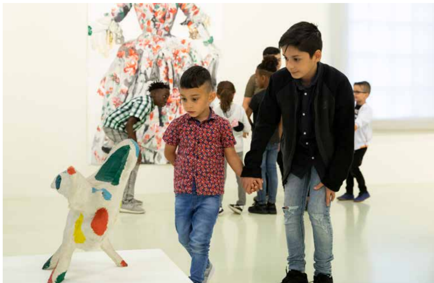
Het maatjesproject.

Een bijzondere samenwerking was die met de Dansmavo uit Schiedam. Tweemaal volgden de leerlingen een lesprogramma waarin zij geïnspireerd op een tentoonstelling in het museum zelf een choreografie ontwikkelden, die ze vervolgens live in de tentoonstellingszaal uitvoerden voor het museumpubliek.