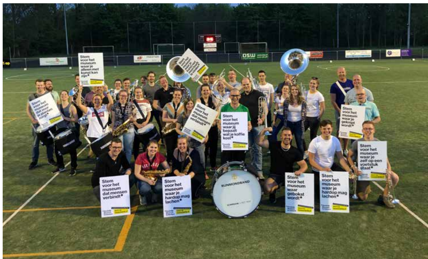
De Rijnmondband steunt ons.