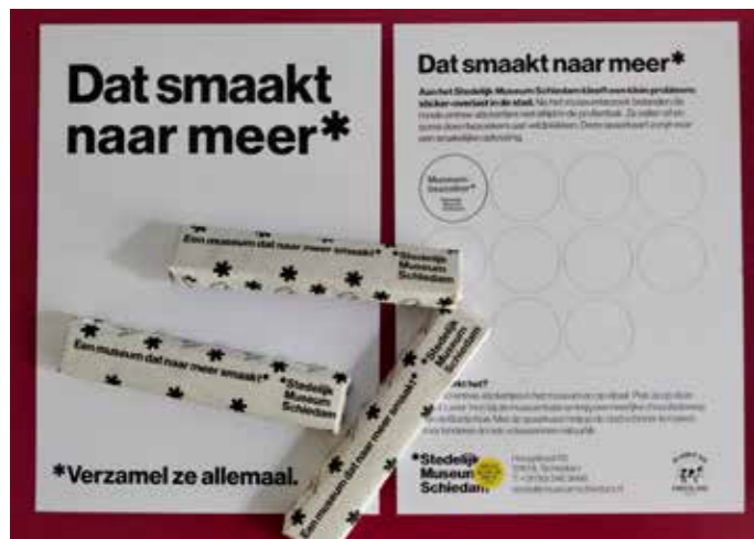
Chocoladerepen en spaarkaat.

Samen met chocolaterie De Bonte Koe bedacht het museum een heerlijke manier om de overlast van entreestickertjes op straat tegen te gaan: een spaarkaat. Wie daar tien gevonden entreestickertjes op plakt krijgt van ons een gratis chocoladereep. Het gezamenlijke initiatief helpt de stad schoner te houden. Bezoekers kunnen de chocoladereep ook kopen.