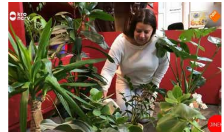
Onze plantvakantie komt langs bij het televisieprogramma Jinek, 2 aug 2019.