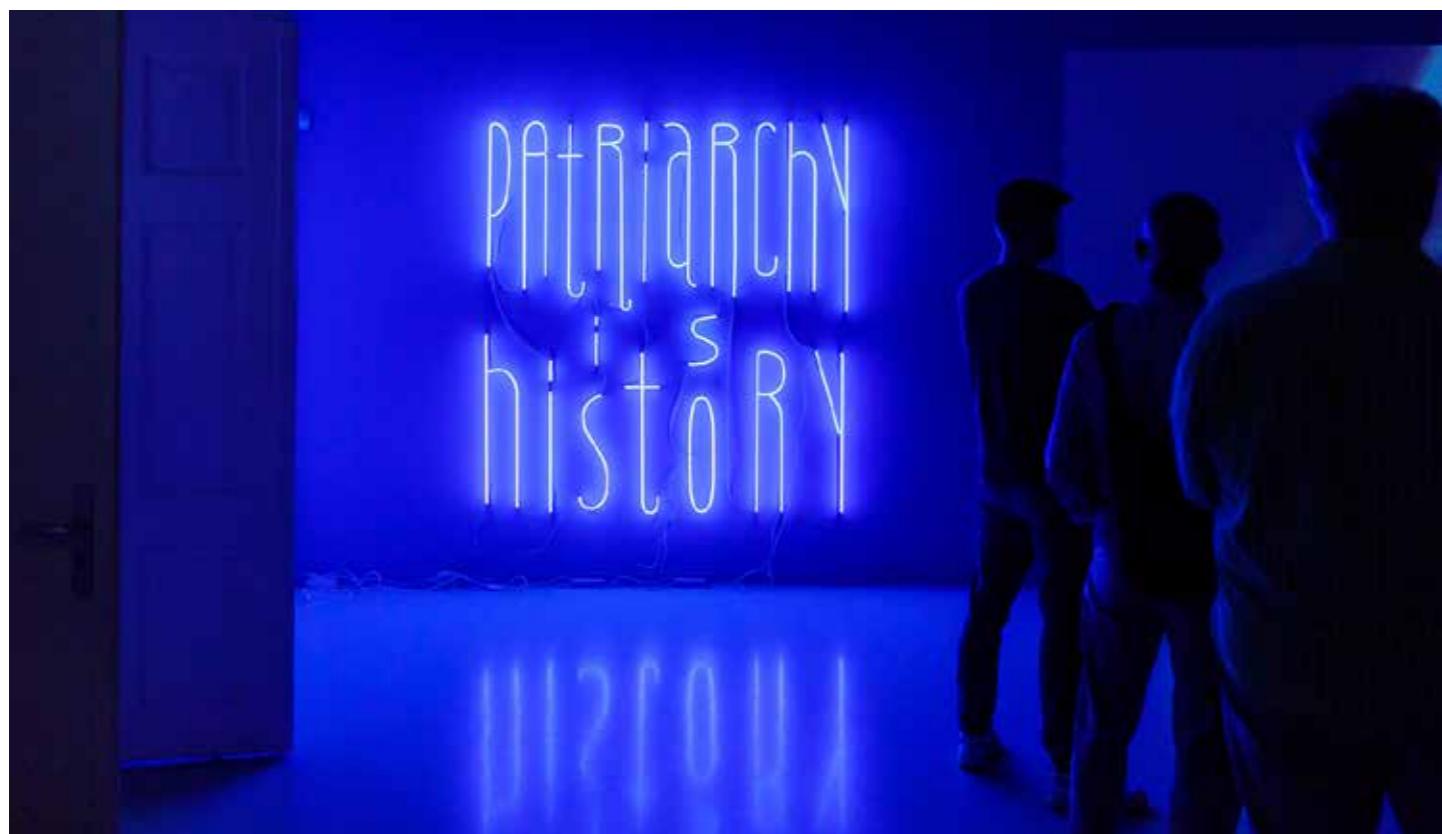
Yael Bartana, Patriarchy is History, 2019. Aankoop collectie Stedelijk Museum Schiedam en SCHUNCK.