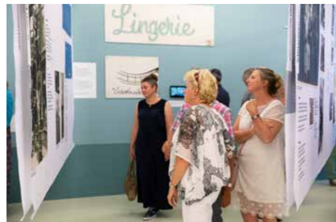
Bezoekers herkennen zich in de tentoonstelling In de Hoogstraat .

De Hoogstraat is een straat vol verhalen, van kabouter tot kinderwagen, van paard tot koekje. Het is een van de oudste wegen van Schiedam, een winkelstraat en een woonstraat.