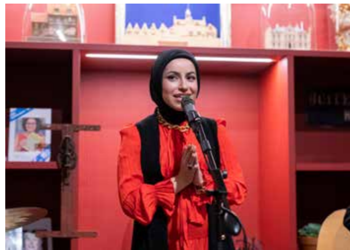
Zingen met Mona Haydar.

Rond de tentoonstelling Modest Fashion in het najaar vonden er nieuwe activiteiten plaats in het museum, van kimono's maken op zolder onder leiding van Anita de Groot tot een Meet & Greet inclusief mini-concert met de Amerikaanse rapper Mona Haydar en van een Modest Fashion Fair met modeshows tot een symposium in de Arminiuskerk in Rotterdam.