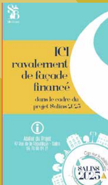
Ci-contre : Ces bâches aux couleurs du programme de rénovation seront prochainement apposées sur les immeubles salinois ayant bénéficié d'aides.

Madame travaillant aux Rousses et Monsieur à Dole, Salins représente un « mi-chemin » qui les a séduit, la prime d'accueil étant le « petit plus » qui a emporté la décision. Comme leur dossier répondait parfaitement aux critères d'attribution de cette prime d'accueil, ils ont été parmi les premiers nouveaux Salinois à en bénéficier.