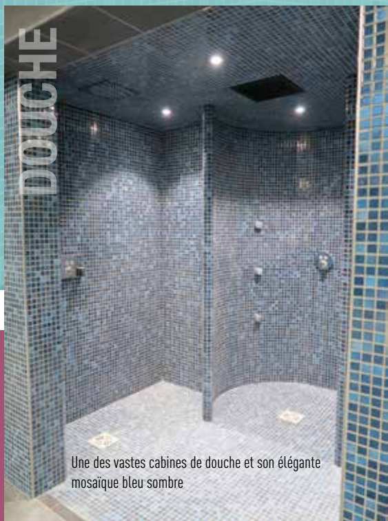
Une des vastes cabines de douche et son élégante mosaïque bleu sombre