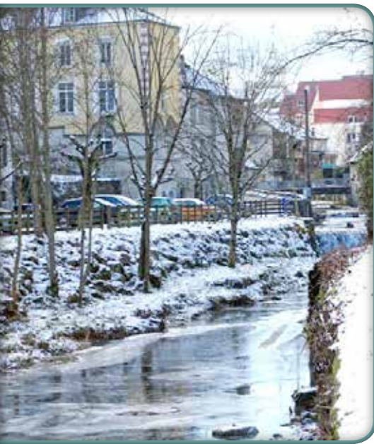
Ci-dessus : Les berges de la Furieuse gelée rue des Barres

Suite au début de réflexion de la Ville de Salins sur l'aménagement d'un cheminement doux entre les nouveaux Thermes et le Centre-Ville sur les berges de la Furieuse, la CCPS qui a compétence sur l'eau a souhaité signer une convention avec la Ville de Salins, pour restaurer dans le même temps l'hydromorphologie de la rivière, et mieux garantir les équilibres écologiques et la viabilité de la faune aquatique.