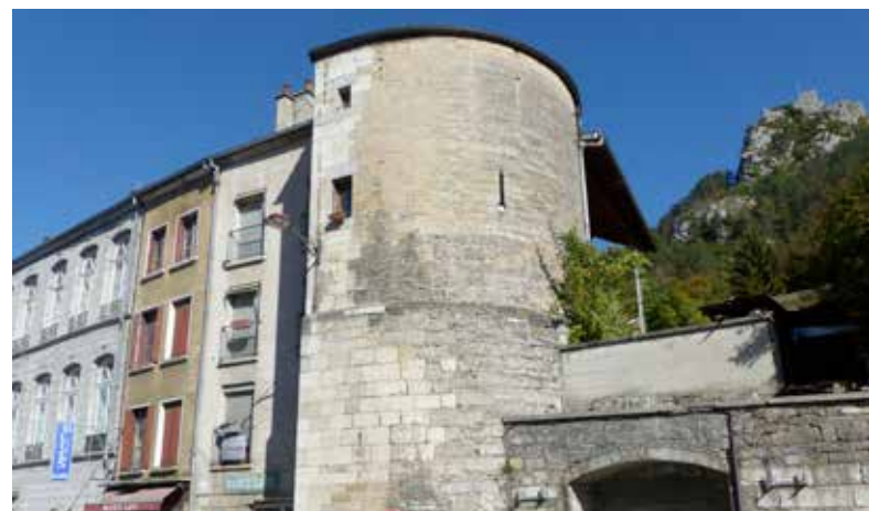
Ci-dessus : La bâtisse vue de la rue de la République