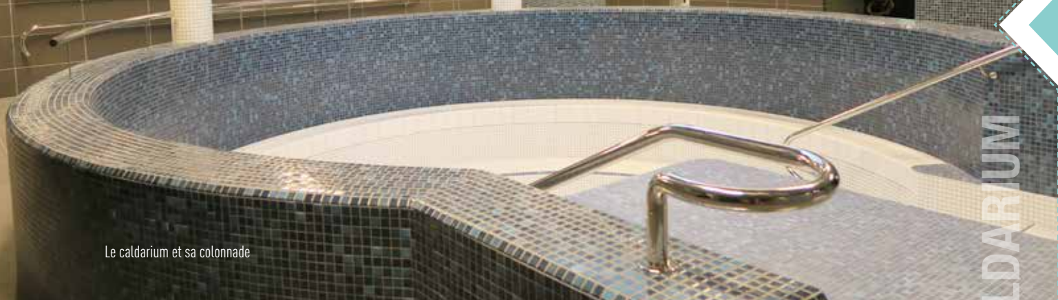
Le caldarium et sa colonnade