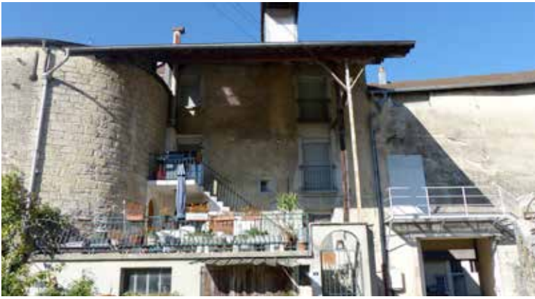
Ci-contre : La bâtisse vue du chemin des Tours Bénites