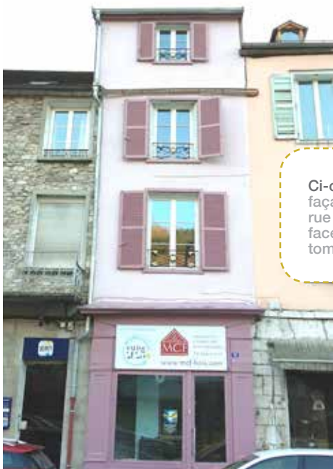
Ci-contre : La première façade subventionnée rue de la République, face à la Saline, à l'automne 2016

Pour les opérations de rénovation de logements ou d'immeubles, plus d'une cinquantaine de contacts ont été pris via soit l'Atelier du Projet, soit les questionnaires distribués en boîtes aux lettres, soit encore le téléphone. Quatre dossiers ont été montés et concrétisés avec des propriétaires occupants (3 dans le cadre des critères « habiter mieux » et 1 dans le cadre des critères « adaptation pour l'autonomie de la personne »). Un premier dossier avec un bailleur a abouti pour rénover un logement qui sera loué en loyer conventionné comme le prévoit le programme d'aides.