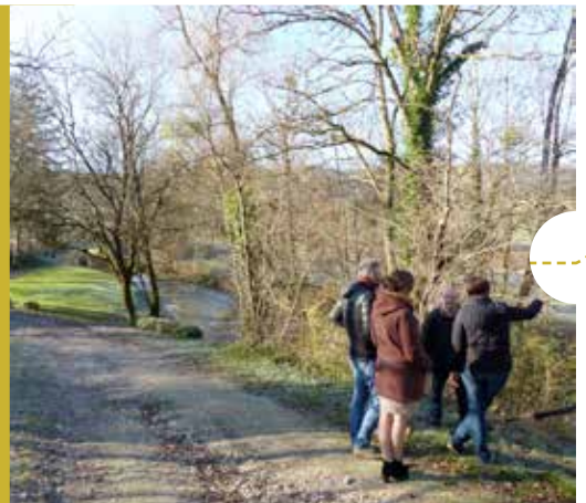
Ci-dessus : La Furieuse à La Chapelle sur Furieuse

(coordinateur pour l'EPTB- établissement public territorial des Bassins Doubs et Saône)