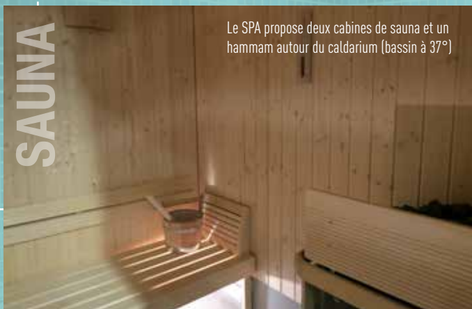
Le SPA propose deux cabines de sauna et un hammam autour du caldarium (bassin à 37°)