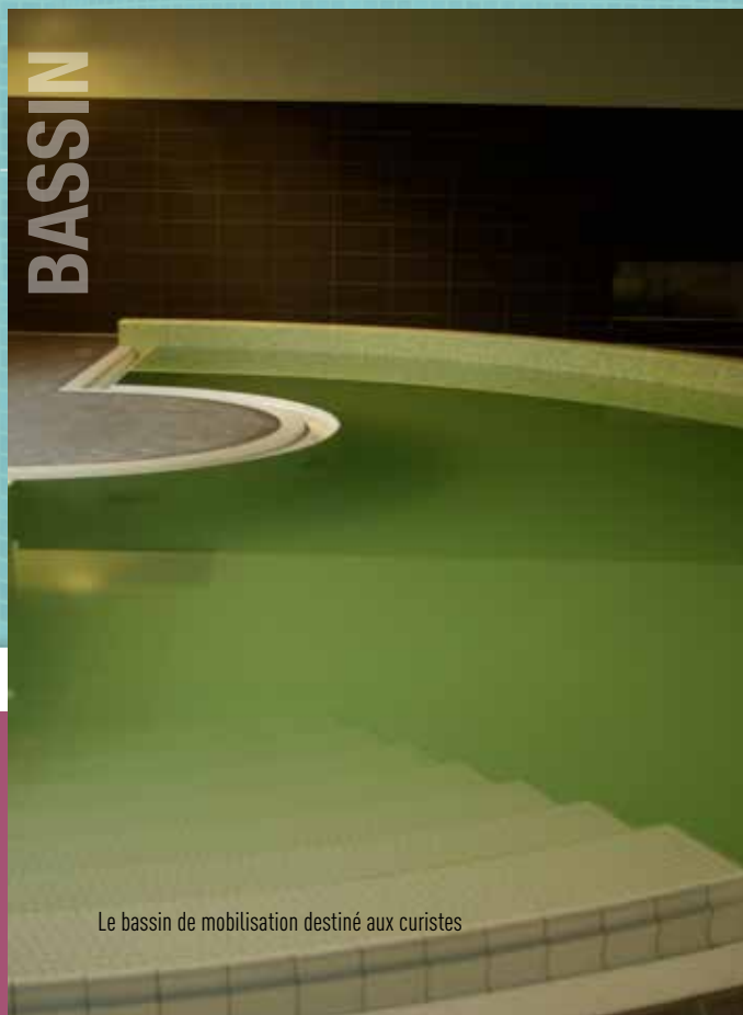
Le bassin de mobilisation destiné aux curistes