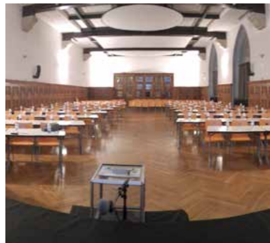
Ci-dessus : Le nouveau conseil communautaire se tiendra dans la salle des fêtes de l'espace Pasteur, à Arbois

ligny (9 rue des Petite Marnes) et les réunions du Conseil Communautaire se tiennent à l'espace Pasteur à Arbois.