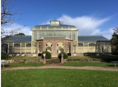
De Wintertuin in het Cantonspark