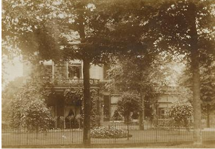
Villa Minareta