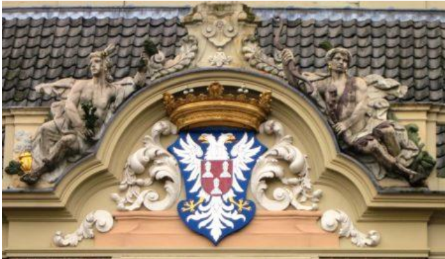
Beeldengroep Kasteel Groeneveld