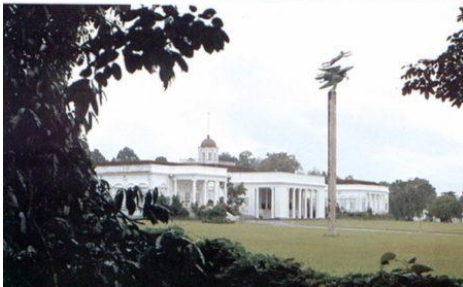
Paleis te Bogor in 1809 en tegenwoordig

Nadat een aardbeving het buitenhuis in 1834 verwoestte, verrees in 1856 op dezelfde plek het 'paleis' dat we nu nog in Bogor kunnen zien. Dit gebouw deed tot 1949 dienst als ambtswoning van de gouverneur-generaal van Nederlands-Indië. Tegenwoordig is het een van de paleizen van de Indonesische president. De villa in Baarn lijkt helemaal niet op de opeenvolgende paleizen die in Buitenzorg/Bogor zijn gebouwd. Alleen de houten jaloezieluiken zijn bij Indische huizen vaker terug te vinden. De Baarnse villa was ook geen paleis maar werd sinds 1840 gebruikt als 'bewaarschool voor arme kinderen'. Toch is er nog wel een band tussen dit Baarnse Buitenzorg en het Indonesische Bogor. De plaquette uit 1991 aan de achterkant van het koetshuis (nu het scoutingmuseum) herinnert aan de band tussen de scoutinggroepen in beide plaatsen.