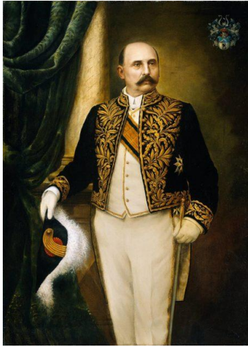
Schilderij van Van Heutsz als gouverneur-generaal (Rijksmuseum)

Jo van Heutsz (1851-1924) was een generaal van het Koninklijk Nederlands-Indisch Leger (KNIL), die het schopte tot gouverneur-generaal van Nederlands-Indië (1904-1909).