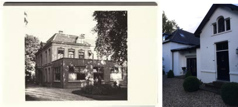
De afgebroken villa Java (ca. 1920) en het nog bestaande koetshuis van villa Java