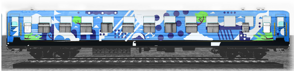
Демо одного з вагонів ГогольTrain

Всі події фестивалю безкоштовні, окремі квитки потрібні лише на театральні вистави (вартість 100 грн, кількість обмежена ). Абонемент на нічну сцену на березі Азовського моря включений у вартість квитка на ГОГОЛЬTRAIN.