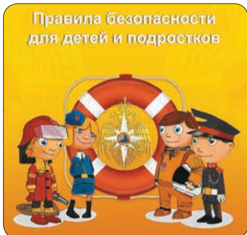
Правила безопасности для детей и подростков

Когда возникает пожар, нередко в панику бросает не только детей, но и взрослых. Но если последние хотя бы в общих чертах знают, что делать при пожаре, то школьники могут испугаться не на шутку и растеряться. Чтобы этого не было, ребёнка нужно учить тому, как вести себя при малейшем признаке пожара, чтобы спасти себя и детей помладше.