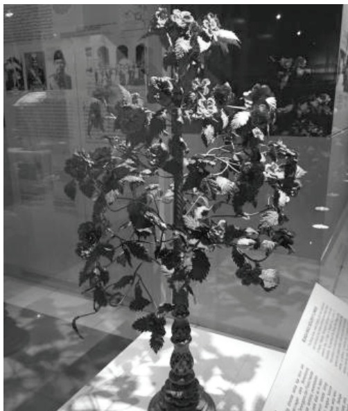
ภาพ 1 ต้นไม้เงินต้นไม้ทอง จากพิพิธภัณฑ์สถานแห่งชาติ มาเลเซีย-กัวลาลัมเปอร์

et al 2005, 128) ต้นไม้เงินต้นไม้ทองเป็นต้นไม้ที่ หลอมจากทองหนึ่งต้นและต้นไม้เงินหนึ่งต้น ประดับ ด้วยกิ่งก้าน ใบโพธิ์และดอกพุดตาล ส่วนขนาดของ ต้น ลวดลายและจำนวนใบและกิ่งก้านนั้นแตกต่างกัน ไปในแต่ละที่ จากบันทึกของไทยชื่อ “ตำนาน หัวเมืองปักษาใต้และมาละยูประเทศ” ต้นไม้เงิน ต้นไม้ทองที่ปัตตานีส่งไปมีความสูงประมาณ 50-60 เซนติเมตรมีกิ่ง 5 ชั้น ก้านอีก 4 ก้าน ปลายกิ่ง ประดับด้วยดอกพุดตาลอีกกิ่งละ 4 ดอก และมีใบโพธิ์ ห้อยกิ่งละ 8 ใบ ที่ยอดก้านสูงสุดประดับด้วย นก ส่งไปพร้อมกับเครื่องบรรณาการชนิดอื่นเช่น ทองคำทราย, หอกคอค (น่าจะหมายถึงสร้อยคอค) ทองเถลิงทอง หอกคอคเงินเถลิงเงิน หอกคอคทองเลว ผ้าขาว พรมเทศ หวายตคำ หวายหิวและกระแซง เตยใหญ่” 4 ต้นไม้เงินต้นไม้ทองของจริงในปัจจุบัน ไม่มีจัดแสดงในพิพิธภัณฑ์ของไทยแต่มีที่พิพิธภัณฑ์ แห่งชาติประเทศมาเลเซีย ซึ่งมีขนาดใกล้เคียงกับใน บันทึกข้างต้น (ภาพ 1)