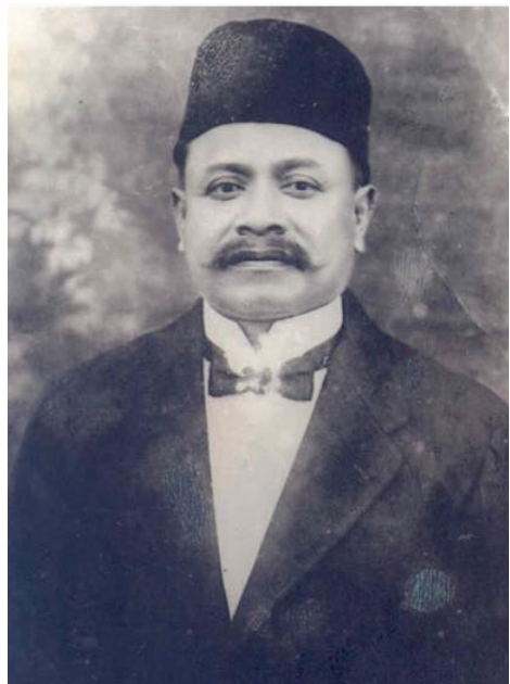
ตนกู อับดุลกาเดร์ กามารุดดิน กษัตริย์ปัตตานีพระองค์สุดท้าย

เป็นที่เข้าใจโดยทั่วไปว่าตนกูอับดุลกาเดร์ แข็งข้อไม่ยอมรับการปฏิรูปการปกครองตามกฎ ข้อบังคับ ร.ศ. 120 อันที่จริงความไม่พอใจของ อับดุลกาเดร์สั่งสมมาตั้งแต่ตอนที่สยามไม่ยอม แต่งตั้งเขาเป็นเจ้าเมืองตานีหลังจากที่บิดาของเขา เสียชีวิตใน ค.ศ. 1899 กว่าสยามจะแต่งตั้งเขาก็ กลาง ค.ศ. 1900 และหลังจากนั้นไม่นานสยามก็