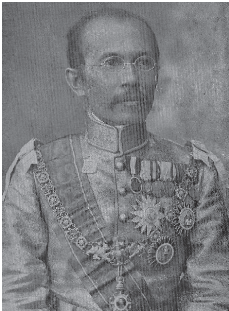
พระยาสุทษณย์วินิต ถ่ายในเครื่องแบบเต็มยศ (พ.ศ. 2452)

อย่างไรก็ตามหากเราดูในมุมมองของนักปกครองของสยามในเวลานั้น จะเห็นว่าพวกเขามองว่าการจัดการในเรื่องต่างๆ ของหัวเมืองบางเมืองดีบางเมืองไม่ดี เมืองที่ไม่ดีนั้นนอกจากจะขาดประสิทธิภาพแล้วเจ้าเมืองยังขาดความยุติธรรมและซูดริตประชาชน หากดูในเรื่องของการคลัง พวกเขาพบว่าภาษีที่เก็บได้มักเข้ากระเป๋าเจ้าเมืองโดยไม่ได้เอาไปทำนุบำรุงเมือง เงินเดือนที่ให้ข้าราชการ (สมัยนั้นเรียกว่ากรมการ) ในสมัยนั้นก็ไม่ได้มาก เพราะกรมการส่วนใหญ่ได้ลดหย่อนหรือละเว้นภาษีแทน เจ้าเมืองบางเมืองเก็บภาษีแบบซูดริต เห็นแก่พวกพ้อง การเก็บภาษีข้าวไม่มีมาตราซึ่งตวงวัดที่แน่นอน การเก็บส่วยต้นไม้เงินต้นไม้ทองในบางเมืองมีการเก็บซ้ำซ้อนมากกว่าสองครั้งในช่วงห้าปี ทำให้ประชาชนเดือดร้อน หากประชาชนขัดขืนจะ