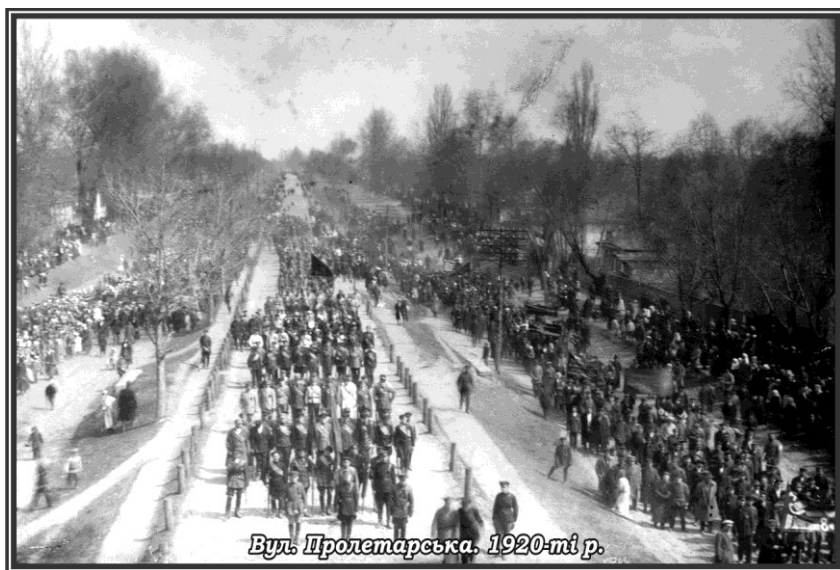
Вул. Пролетарська. 1920-ті р.

Назва вулиці вказує на напрямок дороги, яка поєднує м. Конотоп із с. Соснівка.