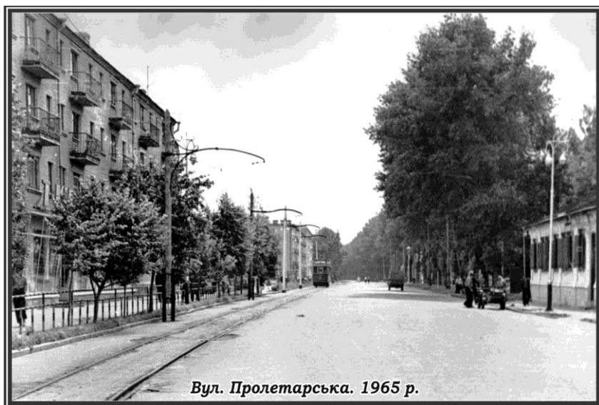
Вул. Пролетарська. 1965 р.

Назва вулиці вказує на напрямок дороги, яка поєднує м. Конотоп із с. Соснівка.