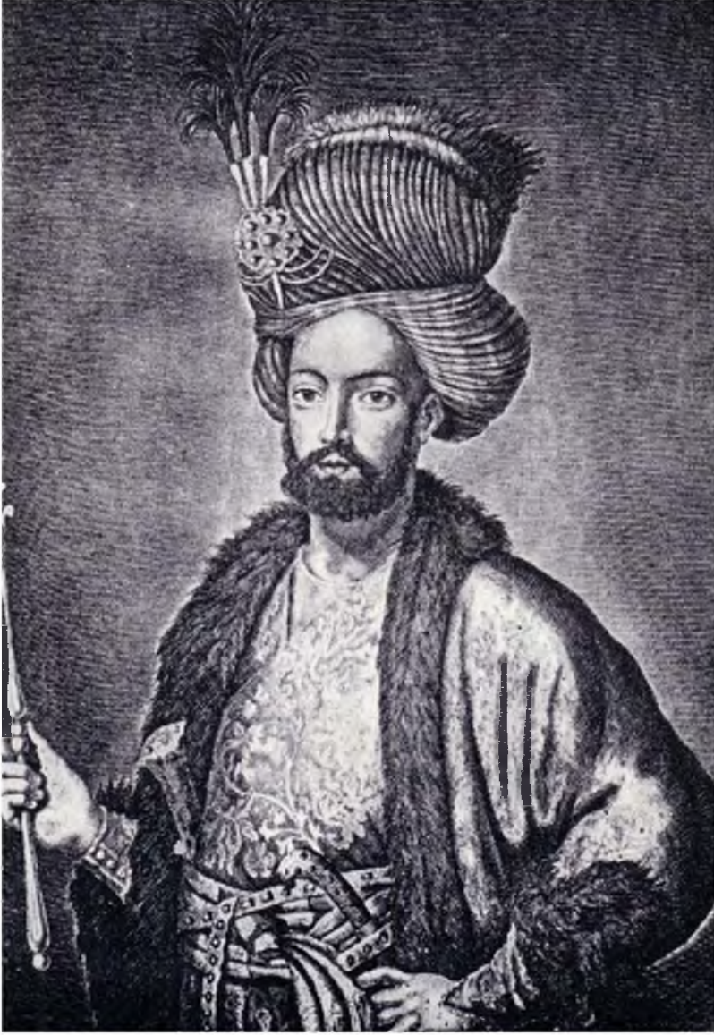
Şah Sülтан Hüseyin