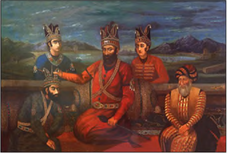
Nadir şah və övladları