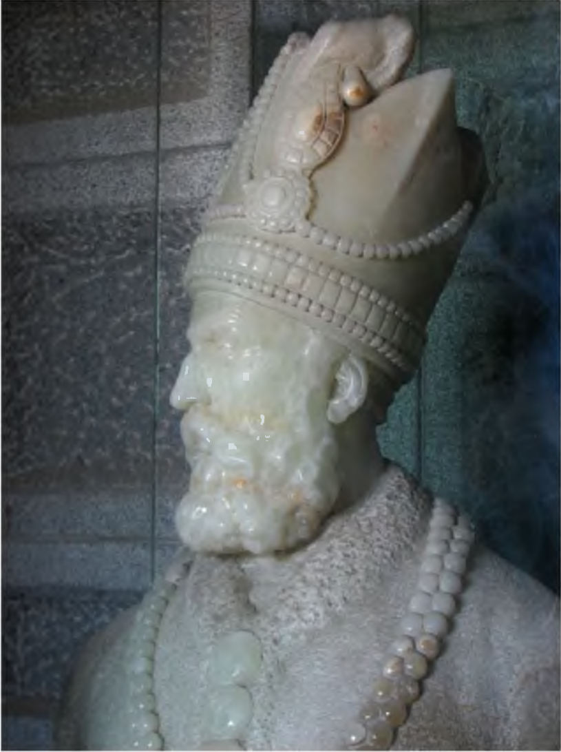
Nadir şahın büstü