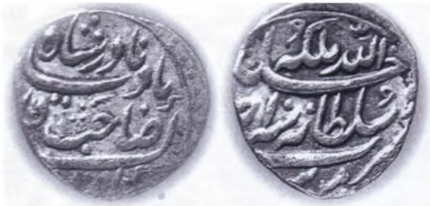
Nadir şahın adına vurulmuş sikkələr