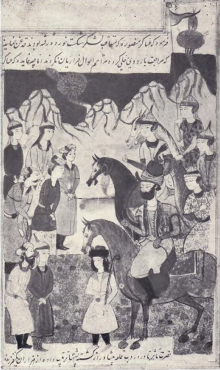
Nadir şahın Hindistan səfəri