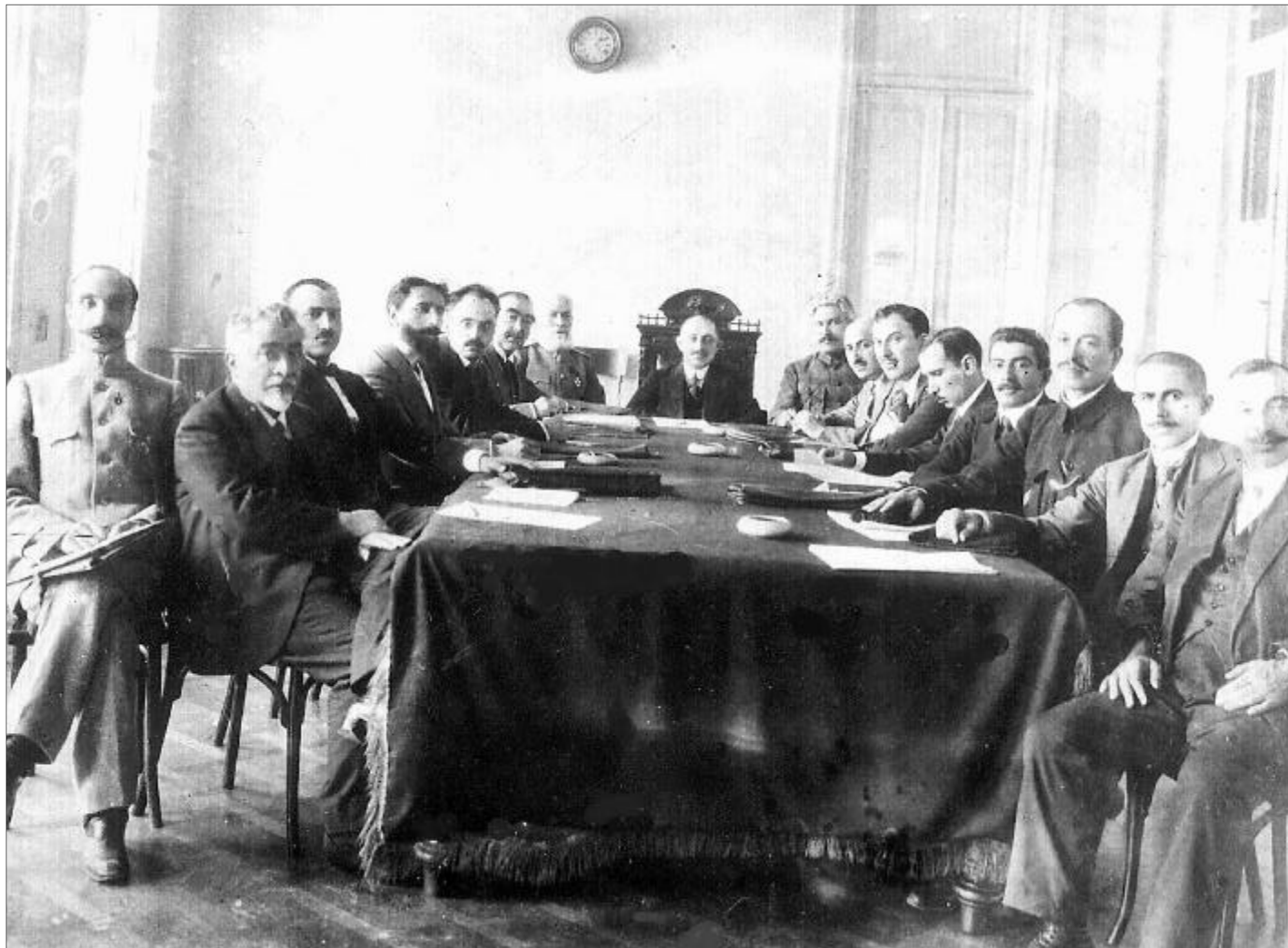
Заседание правления Совета министров АДР 7 мая 1919 г.