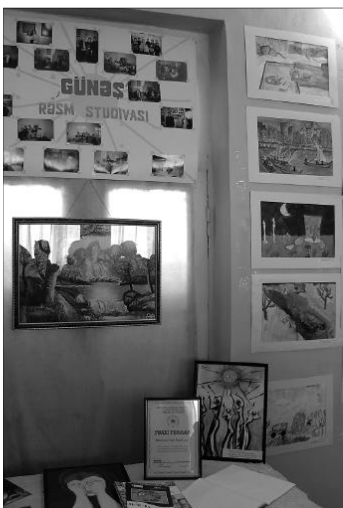
На выставке было много не только рисунков, но и дипломов

Они такие разные, эти юные живописцы... Творчеству каждого из двенадцати отве-