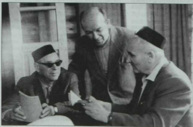
Үткән гасыр әдилләре. Сулдан уңга — Әмирхан Еники (1909 — 2000), Гомәр Бәширов (1901 — 1999), Шәйхи Маннур (1909 — 1980). 1965 елгы фото.