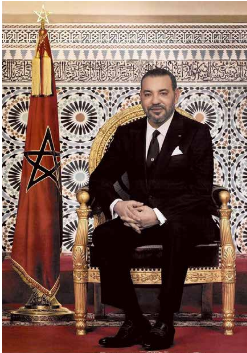
صاحب الجلالة الملك محمد السادس نصره الله