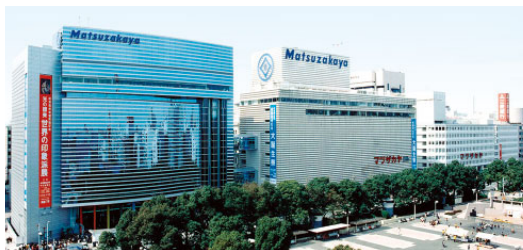
松坂屋名古屋店 (売場面積 86,758㎡)