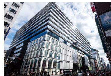
GINZA SIX (売場面積 47,000㎡)