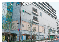
大丸山科店 (売場面積5,403㎡)