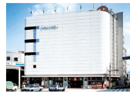
(株)高知大丸 (売場面積 16,068㎡)