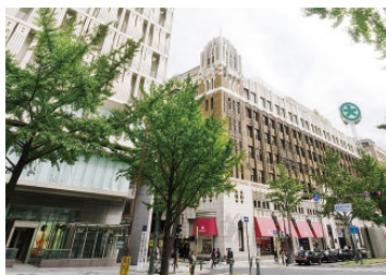
大丸大阪・心齋橋店 (売場面積 46,490㎡) ※新本館は2019年秋に開業予定