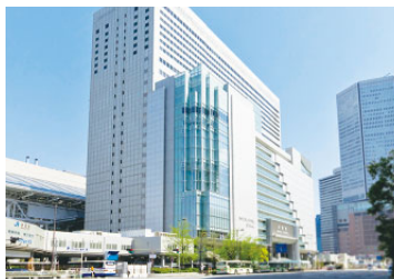
大丸大阪・梅田店 (売場面積 64,000㎡)