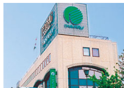
大丸芦屋店 (売場面積 4,300㎡)