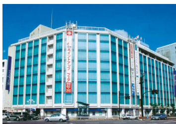
松坂屋静岡店 (売場面積 25,452㎡)