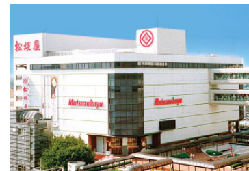
松坂屋豊田店 (売場面積 18,220㎡)