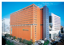
(株)博多大丸・福岡天神店 (売場面積 44,192㎡)