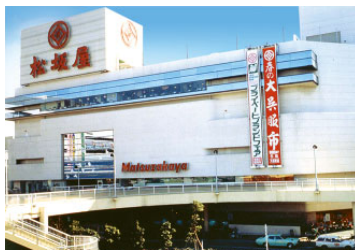
松坂屋高槻店 (売場面積 17,387㎡)