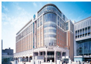
大丸札幌店 (売場面積 45,000㎡)