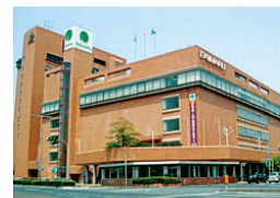
(株)鳥取大丸 (売場面積 13,637㎡)