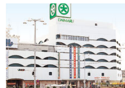
(株)下関大丸 (売場面積 23,912㎡)