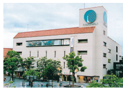
大丸須磨店 (売場面積 13,076㎡)