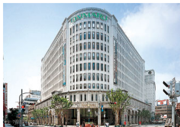
大丸神戸店 (売場面積 50,656㎡)