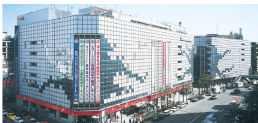
松坂屋上野店 (売場面積 20,888㎡) ※新南館は2017年秋に開業予定