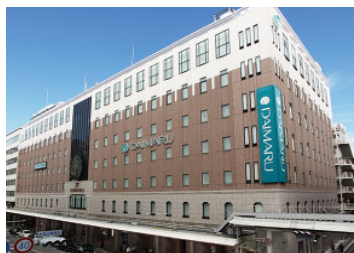
大丸京都店 (売場面積 50,830㎡)