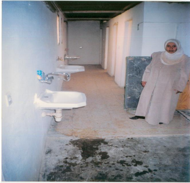
المرافق الصحية في مدرسة الحميمة الأساسية

• يبلغ عدد المعلمين والمعلمات (432) وبمعدل (13) طالب لكل معلم و (23) طالب في كل شعبة وهي نسبة جيدة مقارنة بنسبة الإحصاءات العامة للمملكة.