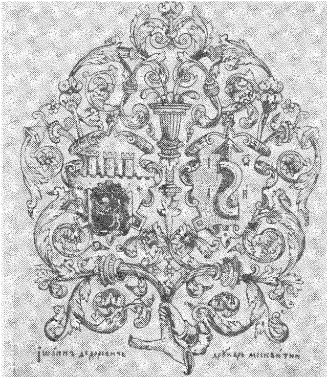
Кінцівка Львівського „Апостола“ з 1574 року з гербами Львова та Івана Федоровича.

В цім році слід спопуляризувати справу видань Федоровича відповідними публікаціями українською і чужими мовами, бо вони заслуговують на те та вказують на багатство нашої культури.