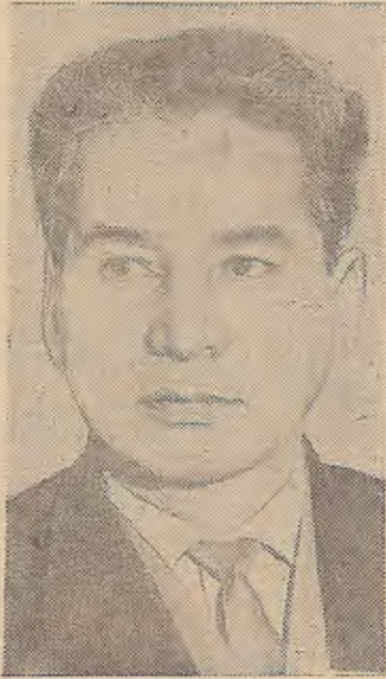
ского ордена Ленина государственного университета имени Ломоносова.