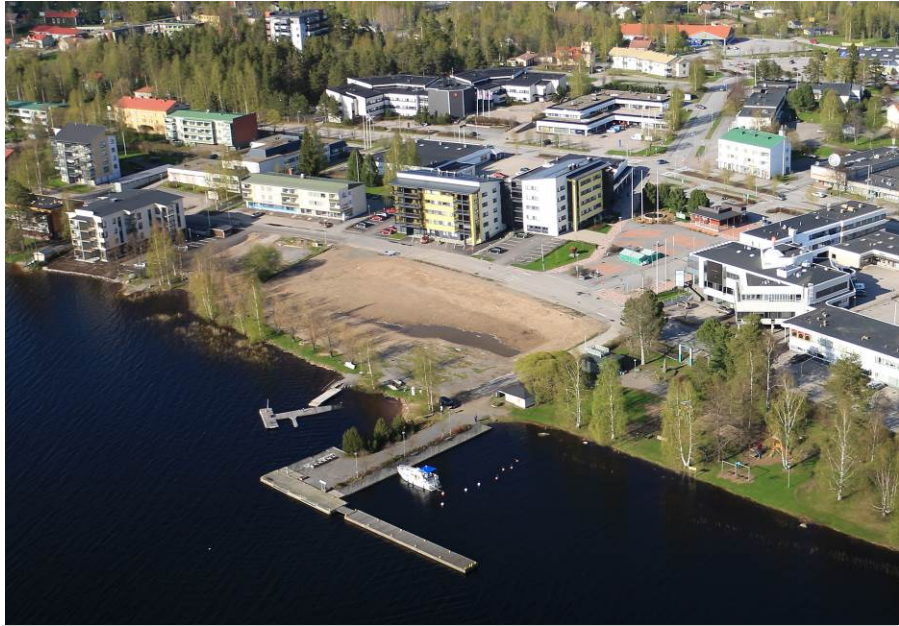
Kuvat 1 ja 2. Torinranta ilmasta katsottuna keväällä 2015 ennen hanketta ja uudelleen kuvattuna kesällä 2016.

Hankkeen kohderyhminä ovat matkailijat, paikalliset asukkaat, mukana olevat yhdistykset ja yritykset sekä välillisesti myös matkailu- ja tapahtumapalveluyrittäjät ja keskustan liikkeitä. Yhteistyökumppaneita ovat olleet paikallinen kiviteollisuus: Vientikivi Oy Finland ja Suomen Kivivalmiste Oy sekä logistiikassa Pohjoisen Keski-Suomen ammattiopisto POKE. Hankkeelle myönnettiin 21.000 € rahoitus. Tästä kaupungin rahoituksen osuus on 6.300 €, josta 4.200 € kuntarahaa Leader-ryhmältä ja 2.100 € suoraa kuntarahaa. Hankkeen toteutuneet kustannukset ovat 21.202,70 €, josta Viitasaaren kaupungin itse maksama kustannusten ylitys on 202,70 €