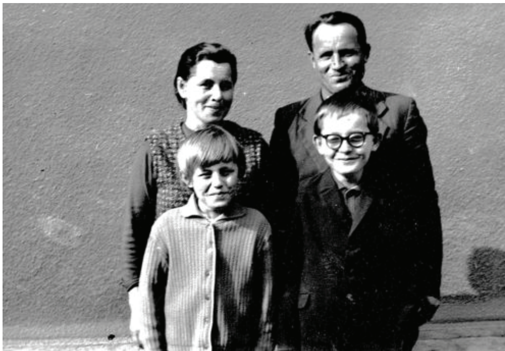
A Kődöbocz család 1967-ben

nem l e t t hanem v o l t és elém hajolt hogy lássam s megéljem benne az érkező nap sugarát a hulló szőlő-virágok zöld csillag-özönét ahogy megérintik a teljes létezést