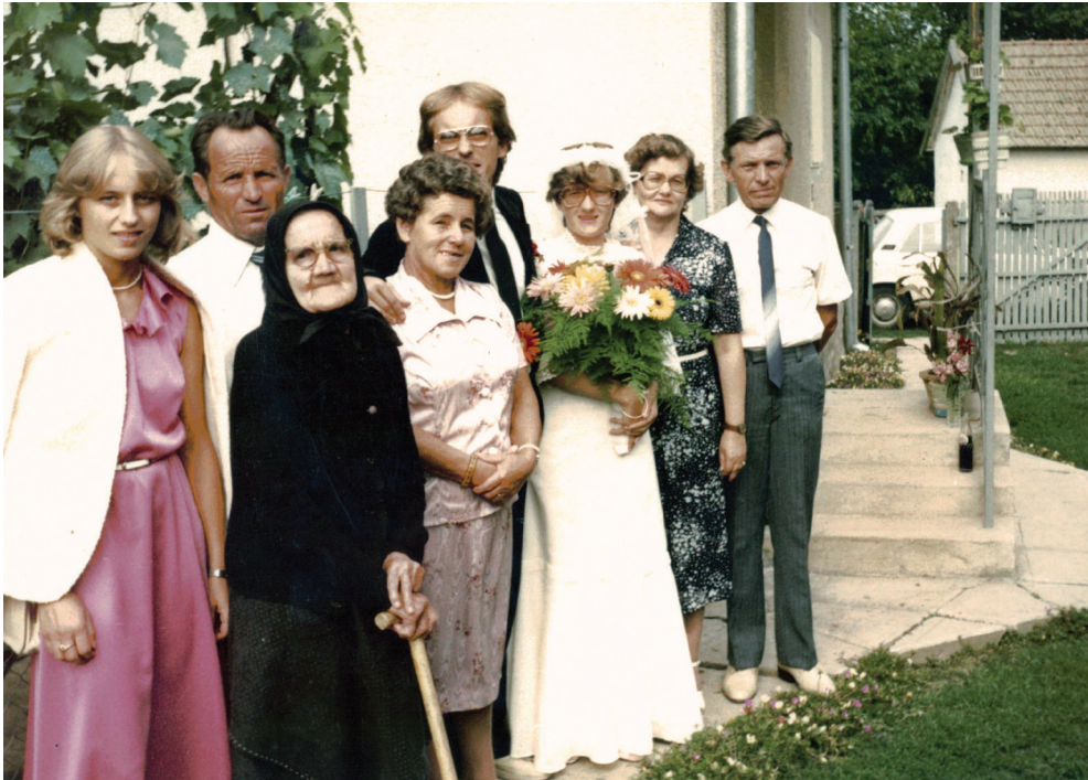
Lakodalom előtti csoportkép

– ... kívül és belül: poklosan örvényült, háborult világ, de a remény sohasem meghaló, ha minden utolsó szalmaszál ABBÓL A JÁSZOLBÓL VALÓ!