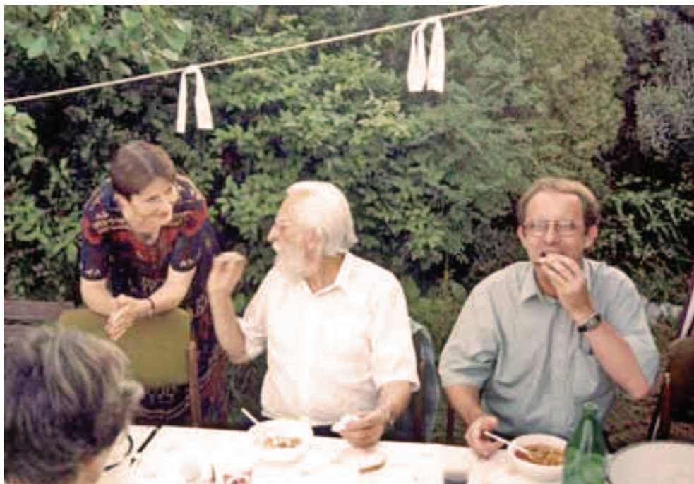
Pillanatkép a 2002. július 21-i dsidas találkozóról

Drága Barátom! Ajándékozzon meg téged a Mindenható hosszú, erőben és egészségben, örömben és szeretetben, alkotókedvben és sikerekben gazdag élettel! Kívánom ezt nemcsak a magam, hanem a Dsida Jenő Baráti Kör nevében is, amelynek a kezdetektől igen értékes tagja vagy.