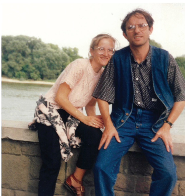
Feleségével a szentendrei Duna-parton