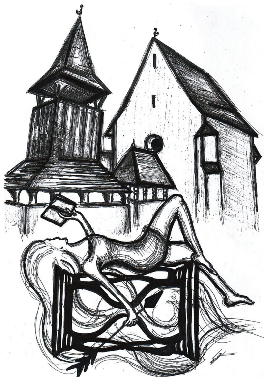
Artemiszi független téridő (Nagy Zita grafikája)

hová vezetnek? a villamos Budapesten vagy Bécsben sebesebb? az éttermi freskó miként fest egy falat mementót kongatva – a gyermekkort – meddig őrzi a harangtorony? a múlt mindig több mint a soha-volt – nem veszít, aki emlékszik – mennyit adott és mettől meddig tartott az út Vámosatyától a Végvárig?