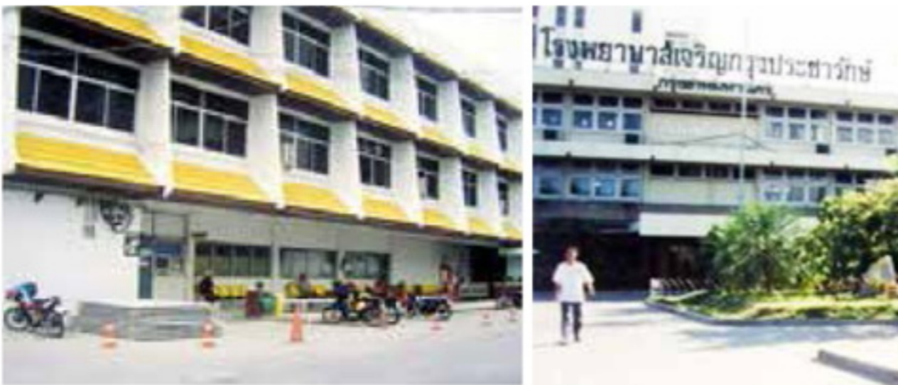
ปี 2529 รับโอนที่ทำการเขตยานนาวา ตัดแปลง เป็นตึกผู้ป่วยนอก ส่วนตึกผู้ป่วยนอกเดิมก็ได้ปรับปรุงเป็น ตึกอุบัติเหตุ ศัลยกรรมกระดูก และทันตกรรม