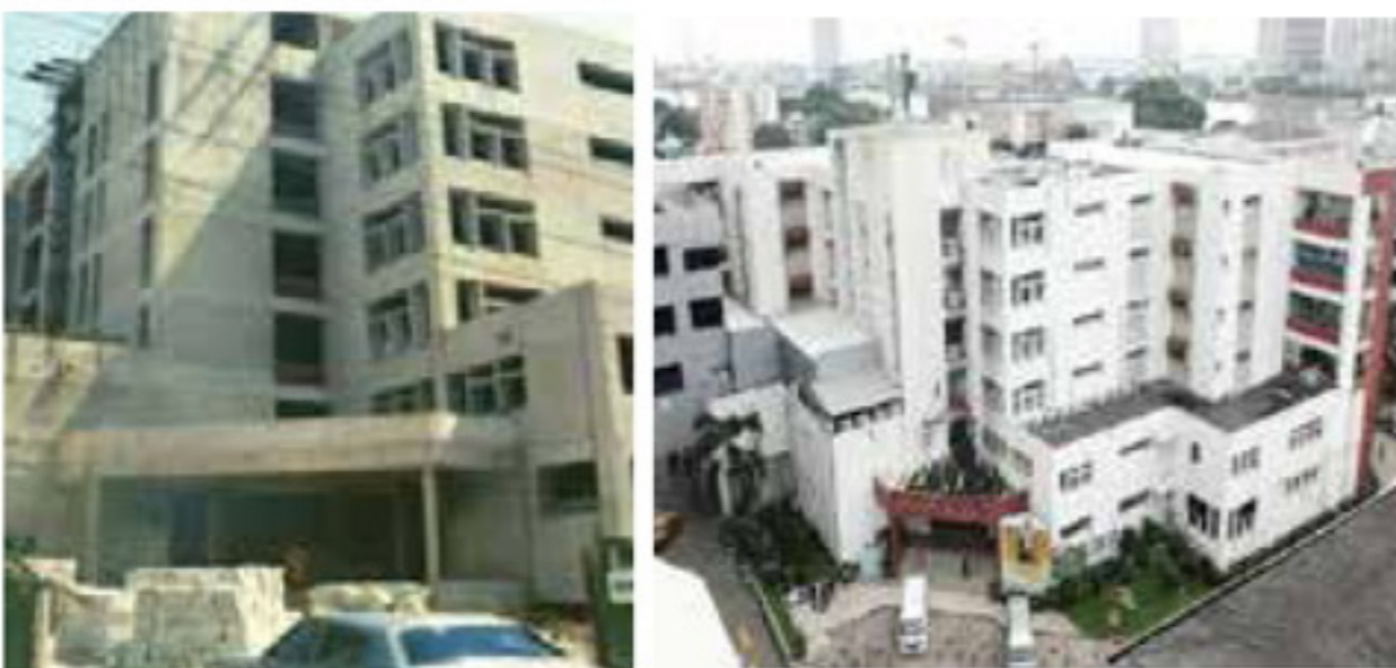
เมื่อโรงพยาบาลฯ ดำเนินการให้บริการมาถึง 20 ปี ได้มีโครงการสร้าง "อาคารอนุสรณ์ 20 ปี" เพื่อ ขยายการให้บริการด้านรังสีวิทยา พยาธิวิทยา ชั้นสูตโรคกลาง หออภิบาลผู้ป่วยหนัก ห้องผ่าตัด และหอผู้ป่วย วงเงิน 80,507,259 บาท