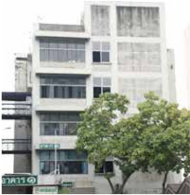
ปี 2525-2526 สร้าง ตึกซักฟอก ครุฑ พัสตุ และ ตึกพักพยาบาล เป็นเงิน 18,250,000 บาท