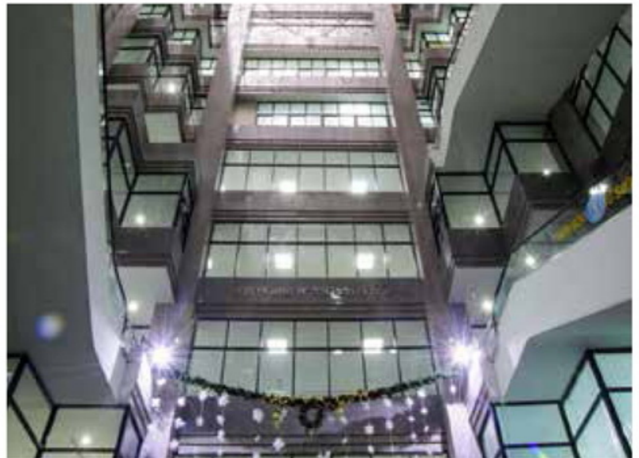
ต่อมาใน ปี 2543 ด้วยความเปลี่ยนแปลงของ สังคม เทคโนโลยี และต้องการภาพลักษณ์ที่ทันสมัย ทำให้มีโครงการสร้างอาคารอเนกประสงค์ 24 ชั้น เมื่อแล้วเสร็จส่งมอบอาคาร เมื่อวันที่ 1 มิถุนายน 2547 โดยได้รับพระราชทานชื่ออาคารว่า "อาคาร ๗๒ พรรษา มหาราชินี"