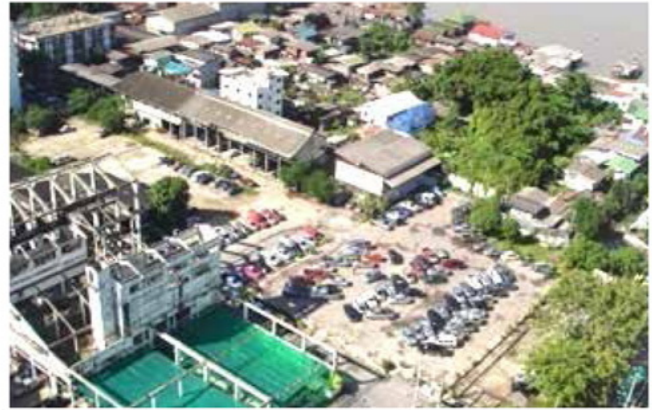
ปี 2536 จัดซื้อที่ดินด้านหลังโรงพยาบาลอีก 7 ไร่ 265 ตารางวา วงเงิน 123 ล้านบาท