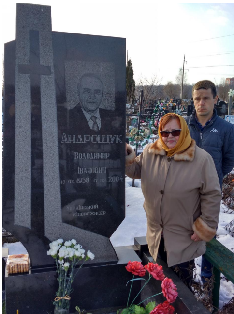
Останній земний прихисток...