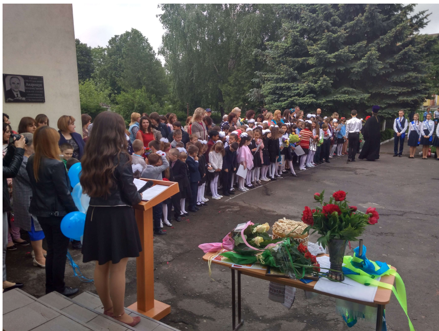
24 травня 2019 р., с. Зимне, школа-ліцей. Свято останнього дзвоника.