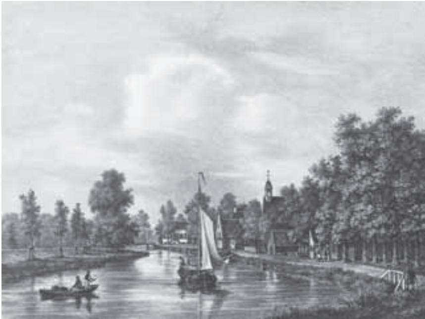
Afb. 5. Zicht op Zuilen door Petrus Josephus Lutgers, 1835/ 36. Slechts een stukje van een schoorsteen en het dak van Zuylenburgh zijn zichtbaar.

Jan Bulthuis koos in 1788 een standpunt veel dichterbij de brug waarop het huis door de aanwezigheid van bomen nauwelijks te zien is. 12 Ten slotte heeft Lutgers een zicht op Zuilen vervaardigd in 1835-'36. Hierop is ter hoogte van Zuylenburgh een deel van een laag dak met een schoorsteen te zien, maar dit lijkt niet op andere prenten vanuit dezelfde hoek getekend (afb. 5).