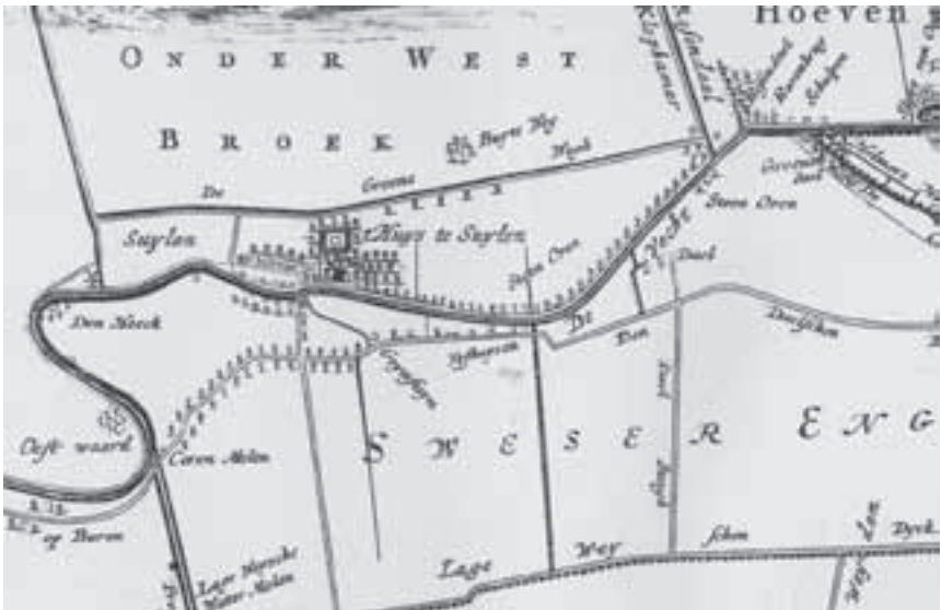
Afb. 2. Caerte van de Vrijheid der stad Utrecht uit 1696 (naar de situatie van 1539) door C. Specht.

letter, maar de tekst ‘Deze erven zijn alle erfpagt’. Te zien is dat er een vorm van bebouwing bestond nabij de brug, op de plek waar nu de straat of de tuin van Zuylenburgh is.