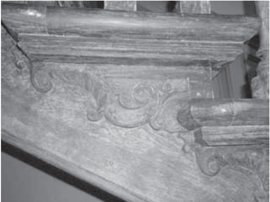
Afb. 6. Decoratie van de traptreden uit ca. 1730.

der toe zijn niet bewerkt, terwijl de decoratie naar de eerste verdieping toe aanzienlijk luxer is uitgevoerd (zie afb. 6). Hierachter bevindt zich de keuken, die oorspronkelijk een dienkeuken was. Een ruime, twee meter brede gang loopt door het midden van het huis. De trap leidt naar de verdieping met zes forse kamers waarboven een grote zolder met vier dienstbodekamers. De uitvoering van het huis is solide en niet overdadig. De plafonds zijn gedecoreerd met eenvoudig stucwerk en in de gang liggen marmeren tegels, waaronder een oudere rode plavuizenvloer ligt.