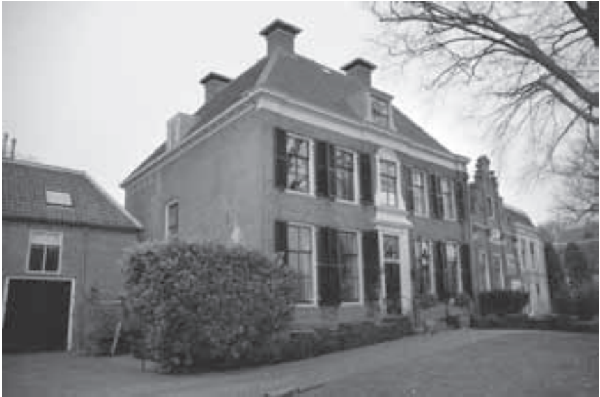
Afb. 15. Zuylenburgh anno 2009 met links het koetshuis en rechts het belendende Swaenevecht .

Zo is dit pand, ruim 250 jaar na haar bouw, weer in oude glorie hersteld en in staat ook de komende eeuwen te trotseren.