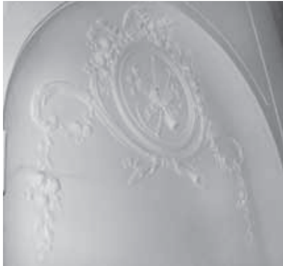
Afb. 7. Nis op de eerste verdieping met stucwerk in Lodewijk XVI-stijl, circa 1680.

en tevens voogd van de kinderen, die van 1 mei 1763 tot '67 voor 400 gulden per jaar het huis betrok. In 1765 en '66 werden wederom enkele zaken aan het huis veranderd en opgeknapt. Zo zijn er facturen, gericht aan de 'erven van Jan van Tuyll' uit die jaren waaruit blijkt dat er aan het huis, het koetshuis, de stal, de schutting, het hondenhok en het bakkershuis maandenlang diverse werkzaamheden zijn verricht: aan de schutting en op 't groote huys, in 't groote huys aan een nieuwe pomp, planken in de goot leggen boven 't coetshuys, paardestal en bakkershuys. Aan de trap werd dagenlang gewerkt (of de trap verfraaid werd of dat een nieuwe trap werd geplaatst, is niet duidelijk), evenals aan luiken en glasramen onder de trap. Tevens werden stenen uit de steenoven (1000 klein rood, 6 wagens savaarde, 900 drieklassoore, 200 kleine bleek) en eiken planken geleverd, werd een gat in de kelder gebroken en werden reparaties verricht aan de pomp en de straat, aan de mestbak, aan de schoorsteen en het dak, aan de stenen voet onder de trap en aan de asbak (vuilnisopslagplaats voor de gemeente, die jarenlang de grond hiervoor huurde van de eigenaar). 22