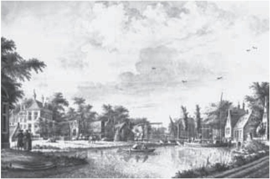
Afb. 4. Gravure van een zicht op Zuilen door Dirk Verrijk uit circa 1743 met twee schoorstenen van Zuylenburgh zichtbaar. (KHA, Atlas Munnichs van Kleef nr. 642)

merrijke bomen, niet geheel te zien is. Het Dorp Zuilen door Daniël Stoopen- daal uit De Zegepraalende Vecht uit 1719 7 (afb. 3) 8 en een prent van Dirk Ver- rijk (afb. 4) van circa 1743 9 zijn vanuit ongeveer hetzelfde gezichtspunt weergegeven. Aan de rechterzijde, ongeveer op de plaats waar het huis nu staat maar meer naar achteren gelegen, is op allebei de prenten te zien dat er twee schoorstenen boven de bomen uitsteken. Gezien de hoogte hiervan moet al in 1719 op de plaats van Zuylenburgh een flink huis hebben gestaan, dat wat verder van de weg af lag dan het huidige pand. Een vage aandui- ding van het dak toont dat dit veel smaller was dan het huidige dak, dat im- mers vier schoorstenen heeft. Het vermoeden rijst hierdoor dat het huidige huis een verdubbeling is van het oude naar voren toe, waarover later meer. In 1756 tekende een anonieme kunstenaar (wellicht J. Versteegh) Zuilen zowel vanuit het noorden als vanuit het zuiden. 10 Op het zicht vanuit het zuiden is goed te zien dat er inmiddels vier schoorstenen op het dak staan. Dit kan er op wijzen dat het huis tussen 1749 en '56 vergroot (of waarschijnlijker nog) nieuw gebouwd is. Ook is er een prent van Dirk Verrijk, gedateerd tussen 1760 en 1780, waarop eveneens vier schoorstenen zichtbaar zijn. 11