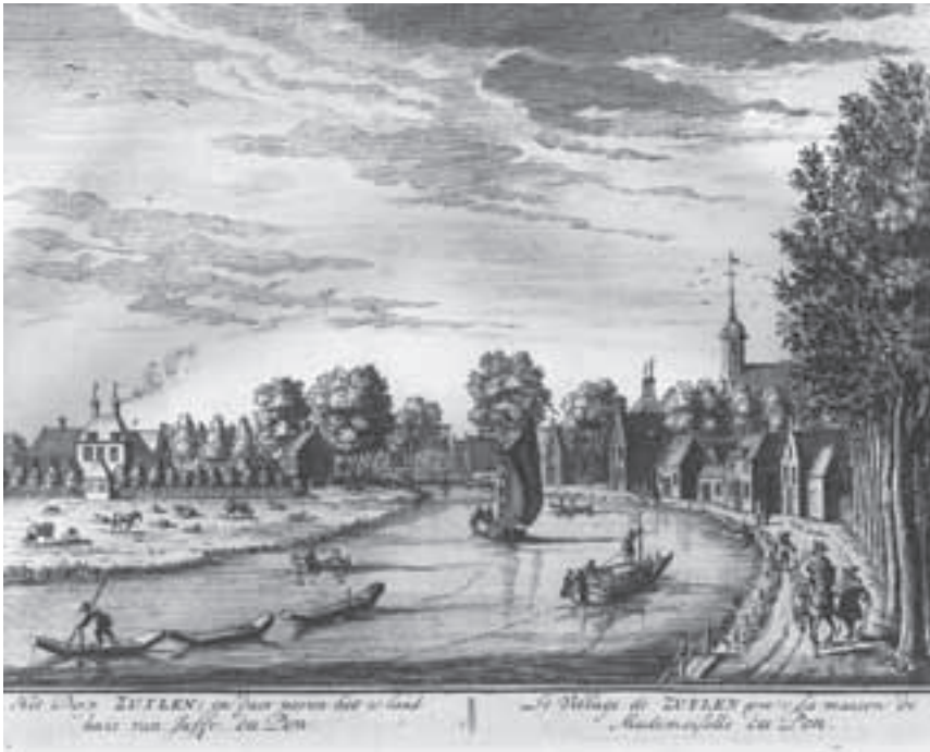
Afb. 3. Gravure nr. 7 uit De Zegepraalende Vecht uit 1719 door Daniel Stoopendaal van het dorp Zuylen, met boven het rechthuis uitstekend het dak met schoorstenen van Zuylenburgh . (Part. coll.)

Een aantal prenten en tekeningen geven meer inzicht. Er bestaan daar diverse van met een zicht op Oud-Zuilen, waarbij Zuylenburgh echter, vanwege het gekozen zichtpunt van de maker en vanwege de aanwezigheid van lom-