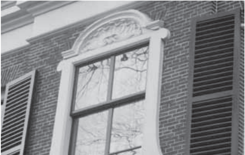
Afb. 8. Decoratie van de middenrisaliet met links en rechts een deel van de hanekam zichtbaar boven het venster.

Rond 1780 zijn namelijk diverse stucversieringen aangebracht in de dan heersende Lodewijk XVI stijl. Zo is op bijgaande foto de nis in de gang op de eerste verdieping te zien, gedecoreerd met een medaillon, strikken en guirlandes (afb. 7). Wellicht zijn toen ook de marmeren tegels in de gang gelegd. Deze zijn namelijk over een eerdere, roodplavuizen vloer, gelegd. Ook de decoratie aan de voorgevel, rond het raam boven de hoofdtoegang, is rond 1780 aangebracht. Achter de gesneden boog boven het venster in de middenrisaliet is duidelijk een deel van een hanekam te zien (de schuin gemetselde bakstenen boven het venster, zie afb. 8). Indien de raamdecoratie tijdens de bouw van het huis was aangebracht, zou men er zeker voor zorg gedragen hebben dat deze hanekam uit het zicht gebleven was.