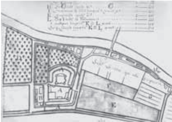
Afb. 1. Kasteel Zuylen met aan de Vecht het rechthuis, de kapel en enige huizen. Bij de brug over de Vecht tussen het jaagpad en de Dorpsstraat staat een nu verdwenen huis ten zuiden van de brug. Kaart van Balthasar Lobé ca. 1650 (HUA, kaartboek Zuilen, inv.nr. 283)