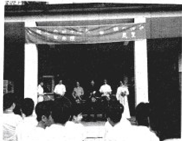
五位神長主持剪綵儀式。

最後，篆刻組獲得本年度之最佳設計獎，天文學會贏得最佳創意獎。而整個展覽亦於九月二十日放學後完滿結束。