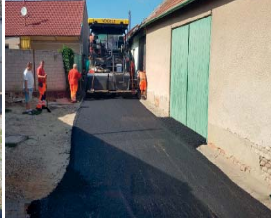
▲ V CHALUPÁCH