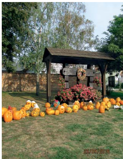
Dýně vyřezali a rozsvítili žáci 1. stupně ZŠ a jejich rodiče.