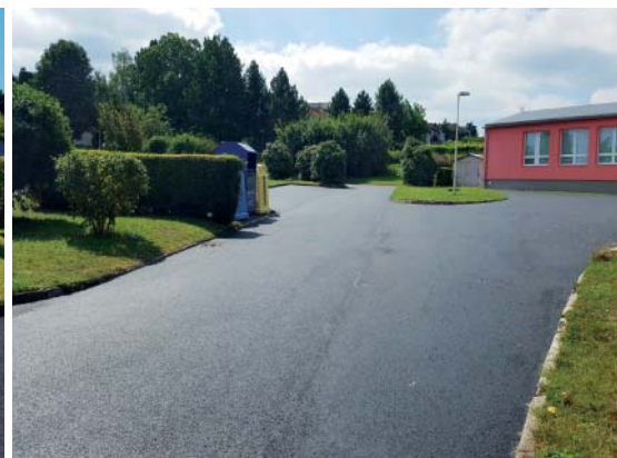
▲ TOČNA U ZŠ