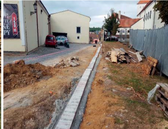
▲ ZÁMECKÁ ZED'