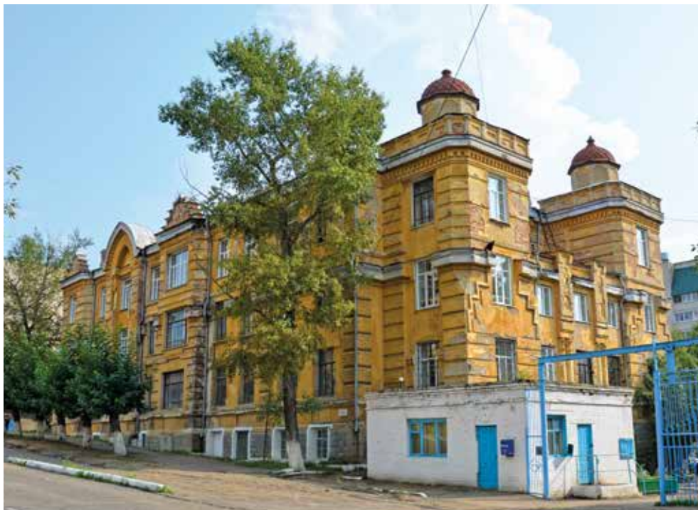
בית הכנסת בצי'טה, נבנה 1907-1908

בתקופת מלחמת העולם השנייה התחדש שוב היישוב היהודי בסיביר: יהודי ליטא, פולין ורומניה הוגלו לסיביר בידי סטלין בשנים 1940-1941 והפליטים מהאזורים המערביים של ברית המועצות שנכבשו על ידי הנאצים