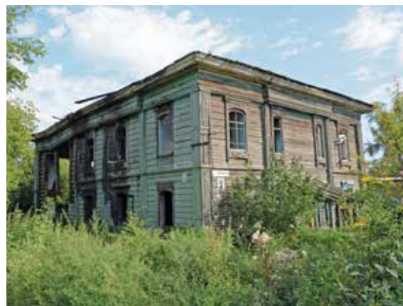
בית הכנסת בקנסק, נבנה 1884

דרך נוספת שאפשרה ליהודים להשתקע בסיביר הייתה גיוס לצבא הרוסי החל מ־1827, במיוחד דרך גיוס הקטינים היהודים ליחידות ה"קנטוניסטים" – יחידות שהכשירו ילדים ונערים לשירות של 25 שנה בצבא (שהתחיל בהגיעם לגיל 18). בתום השירות הממושך, נהגו חיילים יהודים רבים להשתקע באותן ערים שבהן שירתו בצבא ולא חזרו לתחום המושב. היו גם יהודים שהצליחו להסתגל לסיביר בניגוד לחוק. בשנות ה־60 של המאה ה־19 זכו יהודים ממספר קטגוריות ל"אמנציפציה סלקטיבית" (לפי הגדרתו של בנג'מין נתנס): סוחרים מהגילדה הראשונה, בעלי השכלה גבוהה ובעלי מלאכה מיומנים יכלו מעתה לגור מעבר לתחום המושב, אך השלטונות השתדלו למנוע את השתקעותם של היהודים בסיביר ומדיניות זו התעצמה לקראת שלהי המאה ה־19.