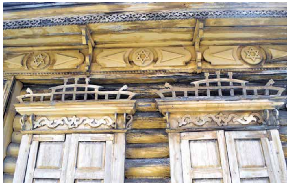
בית יהודי באומסק, סביב 1900