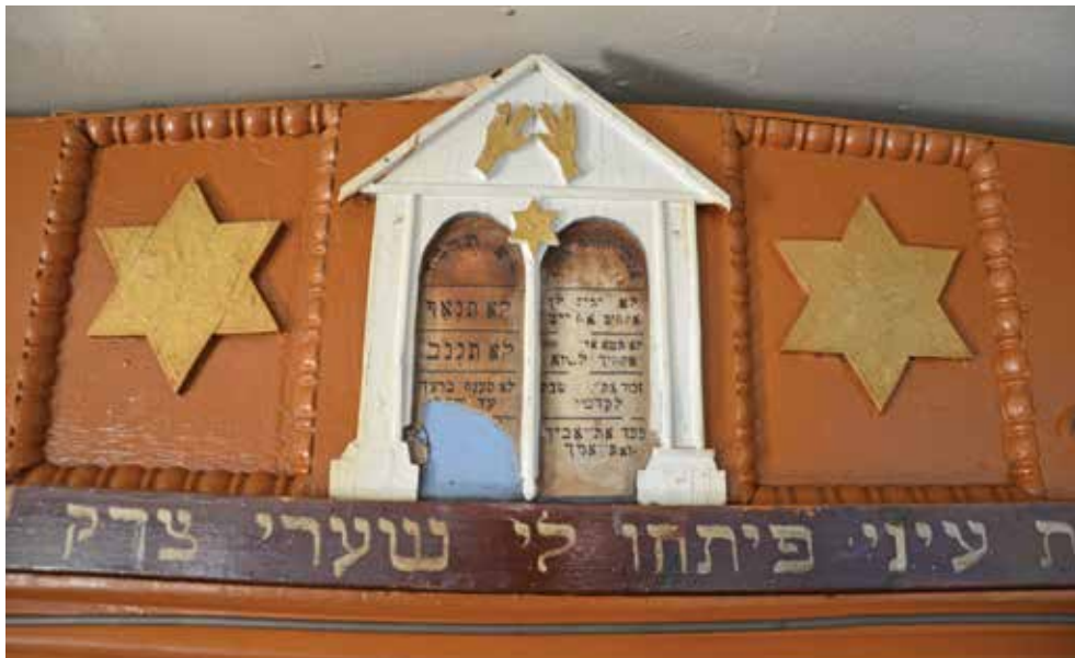
פרט עליון מארון הקודש בבית הכנסת 'בית תשובה' בכירוביג'אן, 1957