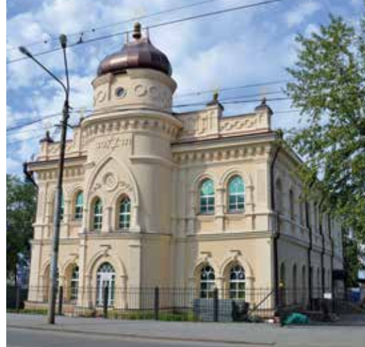
בית הכנסת הכורלי בטומסק, נבנה 1902

כיפות כאלה עדיין ניתן לראות בבית הכנסת של אִיקְוֹטְסְק ובבית הכנסת הכוראלי של טוֹמְסְק. בתי כנסת רבים בערים הסיביריות היו מבנים של שתי קומות. בערים הגדולות זה התאים לסביבה, אך בערים הקטנות, כגון פֶּטְרוֹבְסְק וְבִיקְלֶזְקִי, בית הכנסת היה ועודנו הבניין הגבוה ביותר והבולט ביותר בין יתר בתי העץ הנמוכים.