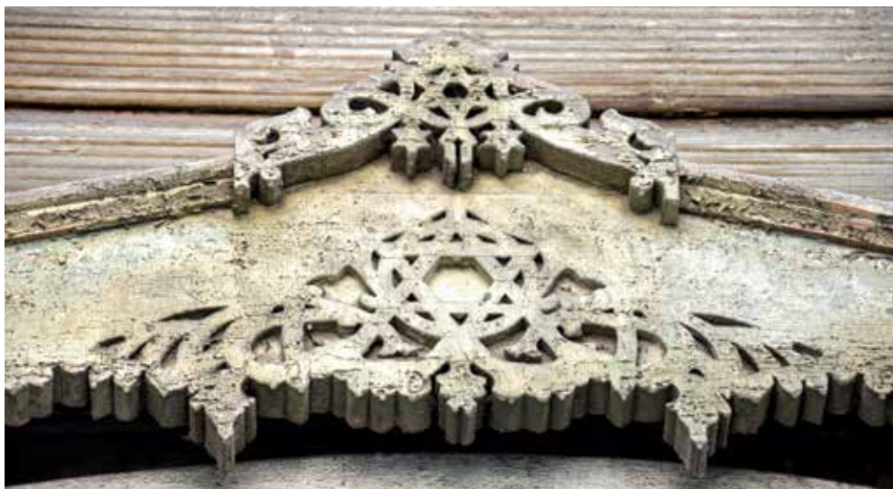
פרט מבית הכנסת של החיילים בטומסק, 1907