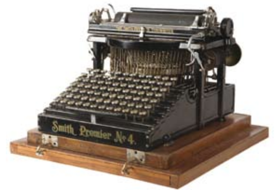
เครื่องพิมพ์ดีด Smith Premier No.4