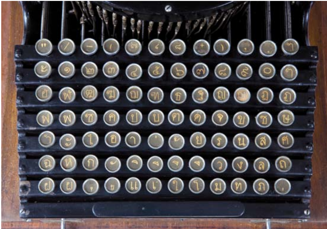
แผงแป้นอักษรของเครื่องพิมพ์ดีด Smith Premier No.4