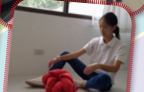
菲律賓酒店工作體驗