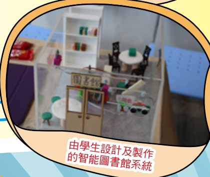
由學生設計及製作的智能圖書館系統