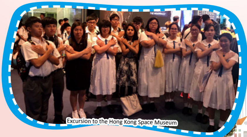
Excursion to the Hong Kong Space Museum