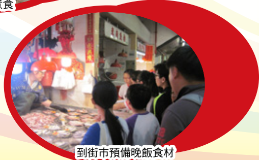
到街市預備晚飯食材