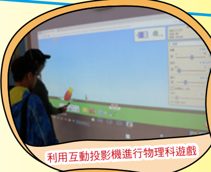
利用互動投影機進行物理科遊戲

為了解STEM教學的最新發展，本校老師於二零一七年十月二十四日的教師發展日，到青衣專業教育學院參觀，認識到STEM如何融入教學之中，及如何提升教學效能，讓老師們大開眼界。