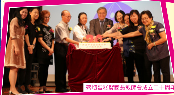
齊切蛋糕賀家長教師會成立二十周年