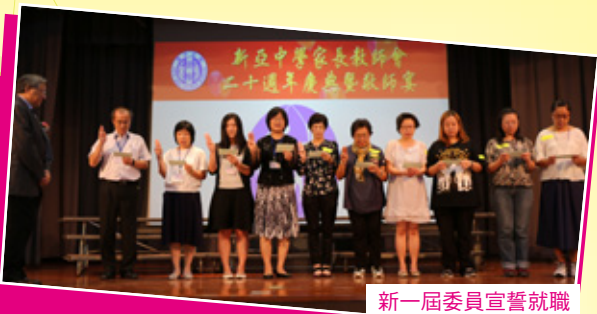
新一屆委員宣誓就職