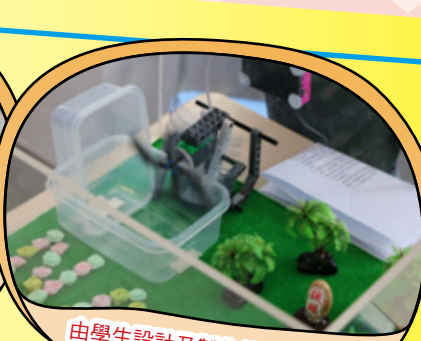
由學生設計及製作的智能花園