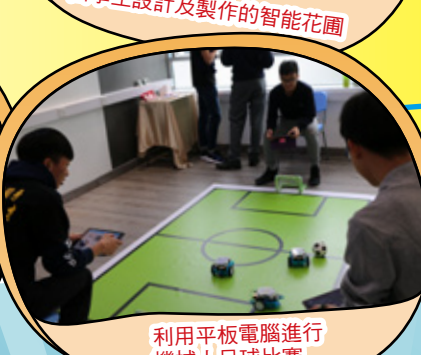
利用平板電腦進行機械人足球比賽