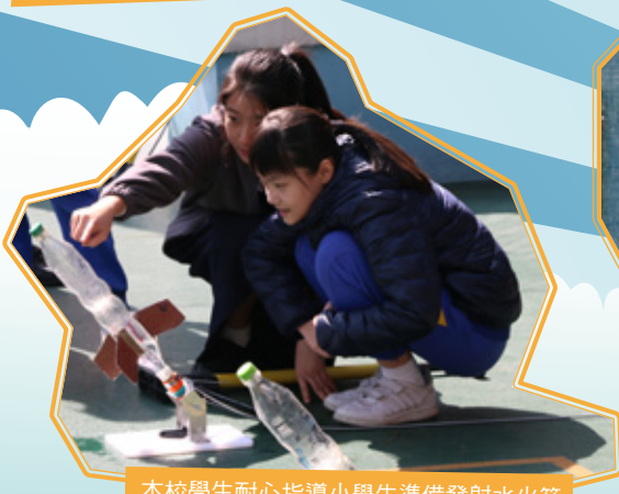
本校學生耐心指導小學生準備發射水火箭