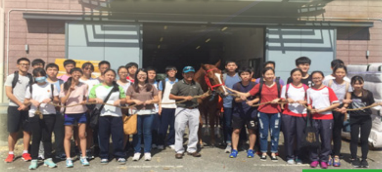
騎術訓練學校工作體驗