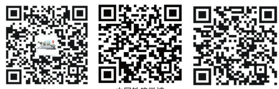
中国铁路微博 中国铁路微博 中国国家铁路集团有限公司门户网站

回望70年的风雨历程，“群众号”列车经历了248/247次、101/102次、61/62次、73/74次、167/168次、71/72次、171/172次、271/272次、571/572次、K271/272次、T271/272次等车次历史变迁，不变的是这趟列车经过70年的雨雪风霜依旧蜿蜒在沿线群众的心坎上。作为一面铁路客运的旗帜，“群众号”列车将一直飘扬在旅客的心中，让旅客时刻都能感受到这份经过70年沉淀的温度。