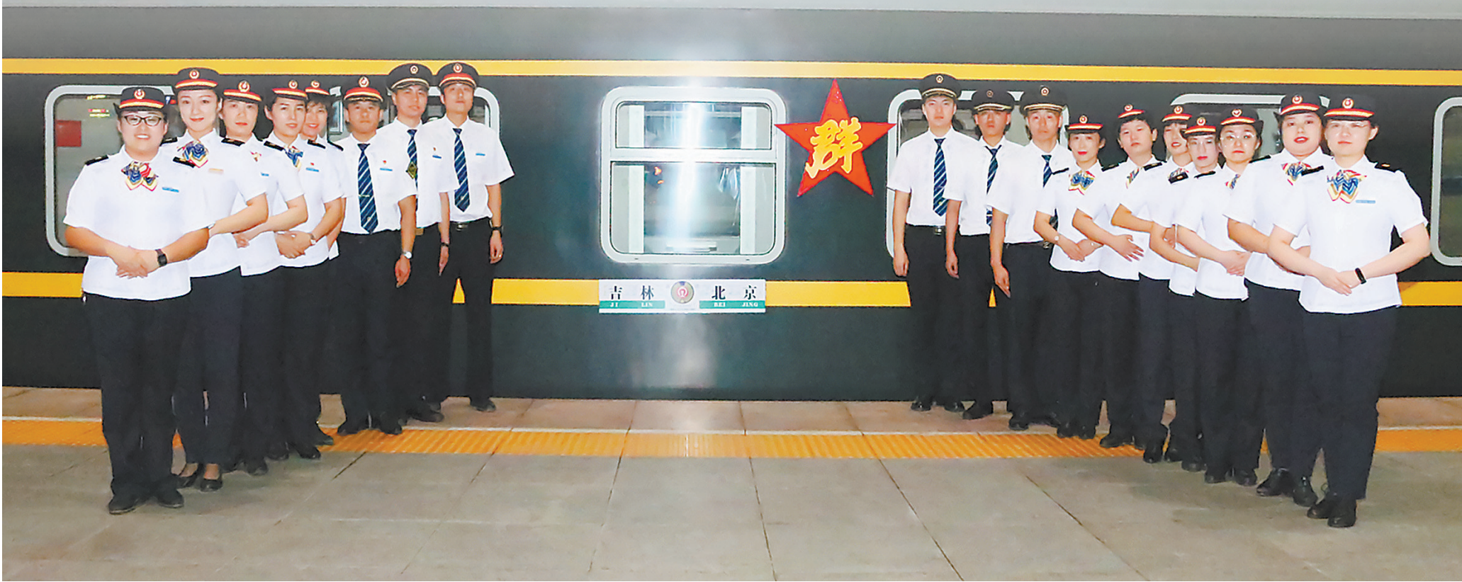
2019年10月1日，吉林客运段吉京五组全体乘务员与“群众号”列车合影留念。