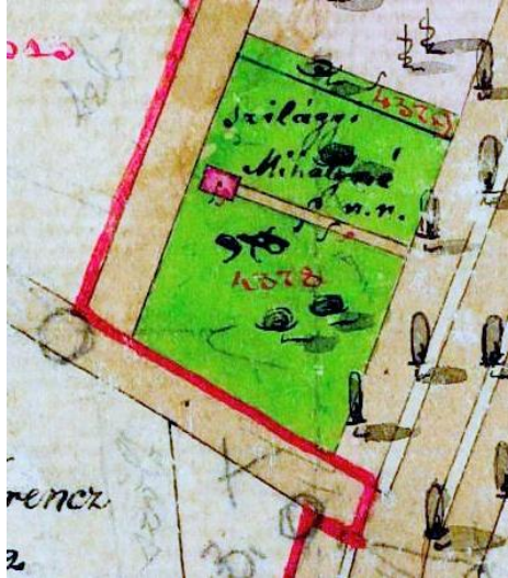
A Sétakert nyugati oldali első kertje és 19. századi épülete

A kataszteri térképlapon látható 376. (fekete) „házszámon”, illetve 4378. (piros) kataszteri számon azonosított telek, a zöld (térképi) színezés szerint teljes egészében kerti művelés alatt állt, a hátsó részen ábrázolt egyetlen építmény és belső útja kivételével. A kert főbejárata a Simonyi úti telekhatár közepén volt, onnan vezetett a barna (térképi) színezésű belső út a hátsó telekrészben – a Sestakertet határoló (Poroszlai) út közelében – berajzolt építményhez. Ez, a hosszabb oldalával a hátsó telekhatárra merőlegesen álló, téglatest alakú ház vörös (térképi) színezést kapott. A korabeli jelrendszerben ez szilárd anyagból készült kő-, illetve a helyi viszonyokban téglaházat mutat.