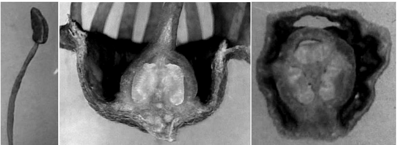
Gambar 4. Beberapa bagian bunga sowang. Benang sari (kiri), penampang bujur hipantium dan bakal buah (tengah), penampang lintang bakal buah yang memperlihatkan plasenta.