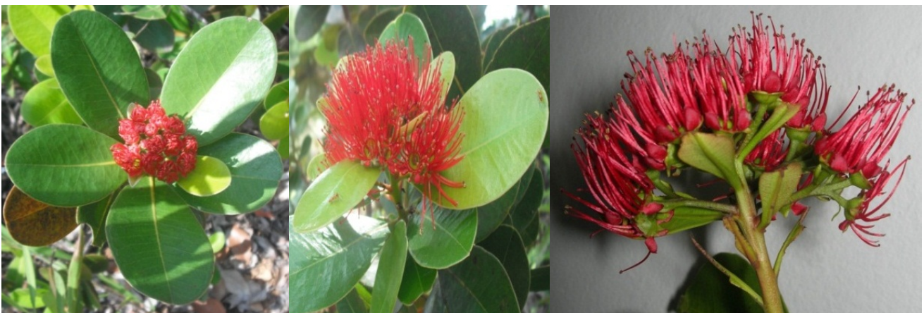
Gambar 3. Perbungaan sowang. Bunga yang masih menguncup (kiri), bunga yang telah mekar (tengah), perbungaan sowang yang memperlihatkan unit perbungaan (kanan).