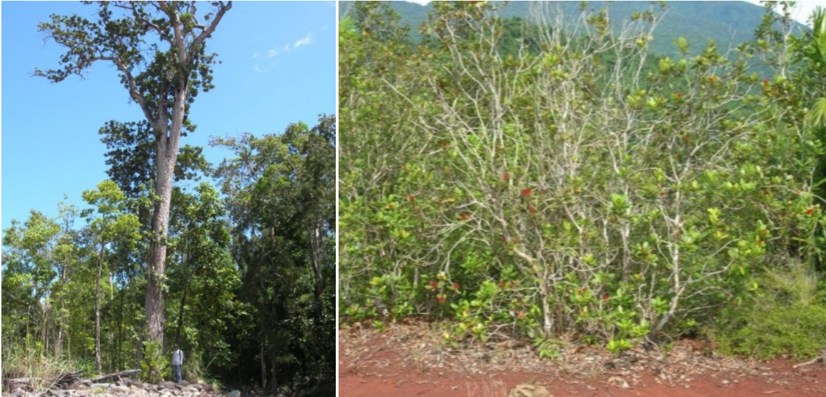
Gambar 2. Tumbuhan sowang yang memperlihatkan perawakan yang berbeda. Tegakan (kiri) dan semak (kanan).