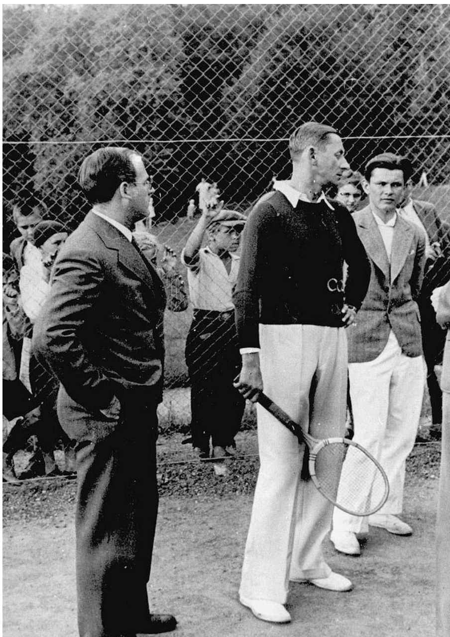
Vlasta Burian na tenisovej exhibícii v Bratislave v roku 1933

aj tak rozbijú, ak nimi mlátite sústavne o zem.“ Podoba s dneškom nie je čisto náhodná... Rozdiel je snáď iba v tom, že v tých časoch sa používali drevené tenisové rakety vyrábané najčastejšie z jaseňa, prípadne javora, hrabu alebo platana. Osobitnou kapitolou bol výplet rakety. V priekopníckych časoch sa struny vyrábali iba z čriev domácich zvierat – hovädzích, bravčových alebo najkvalitnejšie z ovčích. Iste viacerí netušili a netušia dodnes, že na vypletenie jednej rakety bolo treba dvanásť metrov struny, k čomu potrebovali dvestoštyridsať metrov čriev, čo teda znamená, že na struny pre jednu jedinú raketu museli mať k dispozícii črevá z ôsmich oviec. Kvalitu čriev ovplyvňovali také zdanlivé detaily, ako napríklad rasa ovce, charakter pastviny či podnebie, v ktorom ovca prežíva.