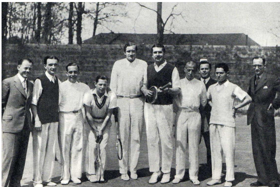
Čs. reprezentácia na kurtoch 1. ČsŠK Bratislava