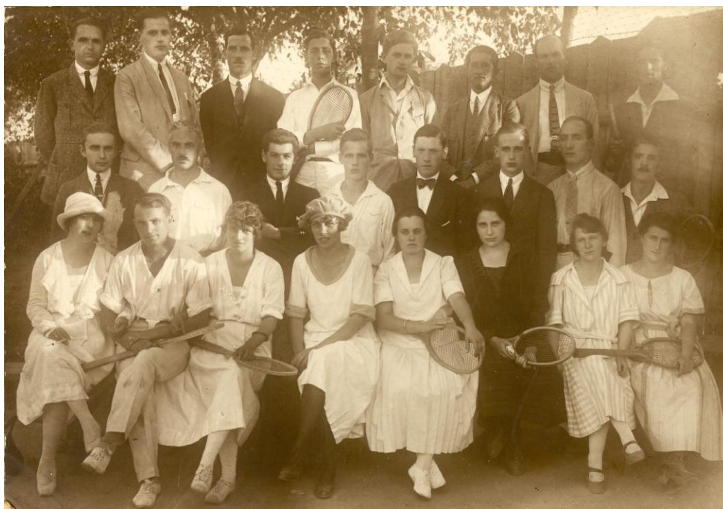
Bratislavskí tenisti v 20. rokoch 20. storočia

„Župné majstrovstvo klubov Západoslovenskej tenisovej župy“ – tak sa oficiálne nazývala tímová súťaž, hraná v dvoch skupinách alebo triedach. V tej prvej šesť kvalitatívne najlepších celkov, ostatní v druhej triede a rozdelení ešte do troch podskupín. V prvej polovici 30. rokov stáli najvyššie bratislavské LTK, I.ČsŠK, ŠK Makkabea, LTC ŽÚ a spolu s nimi tenisti z Trnavy a Nitry. V druhom výkonnostnom „koši“ potom z Bratislavy ŠK Cvernová továreň a Odbor zväzu dôstojníkov a kluby západného Slovenska – ŠK Topoľčany, LTC Hlohovec, ŠK Komárno, LTC Sereď, TTS Trenčín, LTC Piešťany, LTC Trenčianske Teplice a Rapid Trnava. Je nutné podotknúť, že takáto súťaž bola pre úroveň hry prínosom. Čulý medziklubový styk viditeľne prospieval k zvýšeniu výkonnosti hráčov i k popularite tenisu.