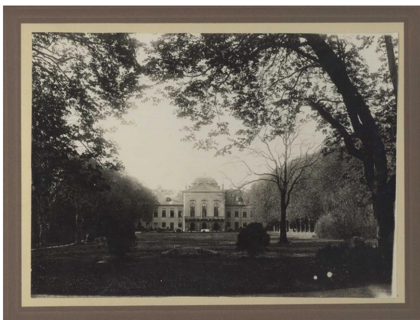
V záhrade Grassalkovičovho paláca stál prvý kurt v Bratislave

Prvý tenisový dvorec v Budapešti otvorili v roku 1881, no takmer v rovnakom období bol vybudovaný aj prvý tenisový kurt v Bratislave. Dal si ho tu postaviť arciknieža Fridrich Habsburský, strýko cisára Františka Jozefa, a nachádzal sa v parku jeho Grassalkovičovho paláca. K pôvodnému kurtu pribudli zakrátko ďalšie tri a boli využívané ako miesta plné trendovej zábavy pri rôznych príležitostiach. Slovné spojenie – športový výkon zatiaľ ešte naozaj nepatrilo k používaným výrazom a noblesa z radov Esterházióvcov, Zičióvcov či ďalších príslušníkov rodov vysokej šľachty, si takto iba spríjemňovala kratochvíle.