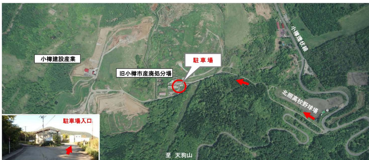
安全祈願会場駐車場 詳細位置図※1