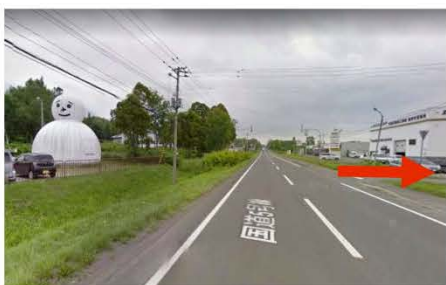
①札幌・小樽方面より会場出入口