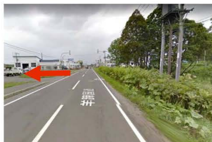
②函館・ニセコ方面より会場出入口