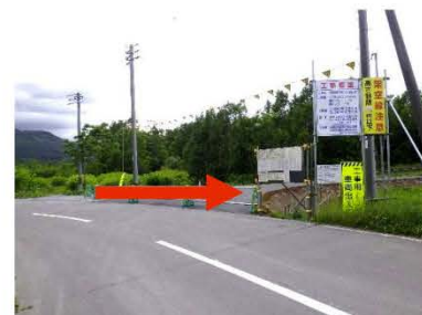
③工事用道路出入口

※周辺駅からの公共交通機関の便がないため、車（自家用車、レンタカー、タクシー）にて安全祈願会場までお越しください。