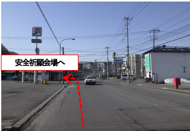
写真①:奥沢十字街方面からの交差点 天神1丁目(天神十字街)