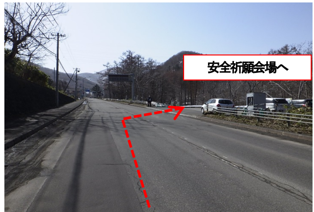
写真②:天神1丁目(天神十字街)方面より 工事用道路出入口(交通誘導員配置)