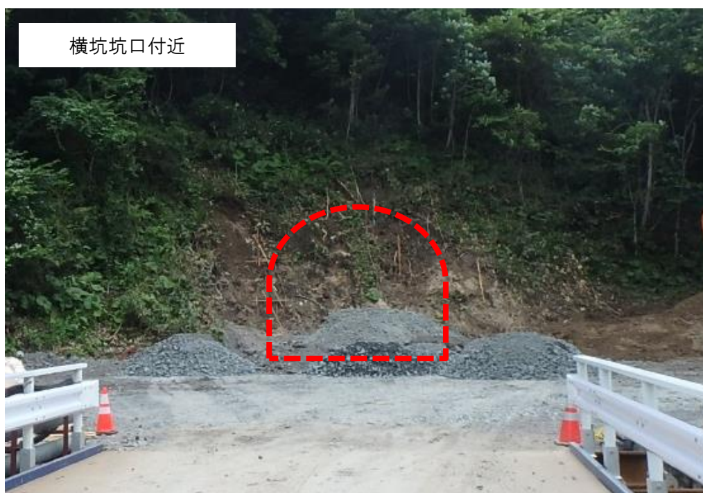
【現在の坑口の写真】

なお、安全祈願は、新型コロナウイルス感染症への影響を考慮し、最小限の出席者で実施することといたしますので、併せてお知らせします。